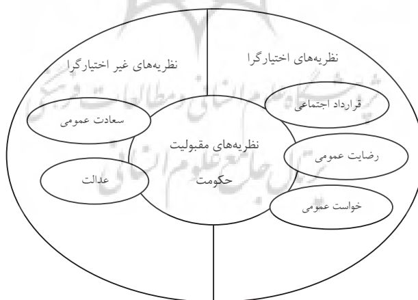
شکل شماره ۲: نظریه‌های اختیارگرا و غیراختیارگرا

از منظر جغرافیای سیاسی مقبولیت حکومت‌ها به حق حاکمیت عمومی مربوط است و افراد یک کشور که صاحب و مالک سرزمین خود می‌باشند، در تعیین چگونگی اداره و افراد اداره کننده آن صاحب اختیار می‌باشند. بنابراین در چهارچوب ارزشهای پذیرفته شده هر جامعه، سازمان سیاسی موظف است که کارکردهای خود را تنظیم کرده و نیازها و انتظارات مردم را برآورده کند. در حال حاضر ملاک نهایی مشروعیت، پذیرش و ارزیابی (گرایش) مردم است و این ملاک مبتنی بر ارزشهای مردم در یک زمان و مکان مشخص می‌باشد (رفیع‌پور، ۱۳۷۶: ۴۵۵). مقبولیت حکومت در حقیقت پاسخی است به این سؤال اساسی که چرا مردم باید از فرامین حکومت پیروی کنند؟ در پاسخ به این سؤال دست کم پنج نظریه: قرارداد اجتماعی، رضایت عمومی، خواست عمومی (خواست اکثریت)، عدالت و سعادت عمومی مطرح شده است. از پنج نظریه فوق سه نظریه اول مسأله مشروعیت را به خواست و اراده مردم وابسته می‌داند که به نظریه‌های اختیارگرا معروفند و نظریه‌های دیگر با ارزشهای اخلاقی و معنوی مرتبطاند و نظریه‌های غیراختیارگرا نامیده می‌شوند (لاریجانی، ۱۳۷۸: ۱۶).