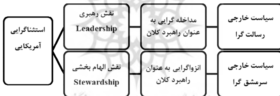
شکل شماره ۱. نقش استشناگرایی در سیاست خارجی امریکا

در دوران ریگان و جورج بوش پسر اشاره کرد. از سوی دیگر، درکی از هویت ملی و استشناگرایی امریکایی که بیشتر امریکا را منبعی الهام‌بخش و صاحب‌نفوذ در دنیا می‌داند، سیاست انزواگرایی را برای عرصه دیپلماسی این کشور تجویز می‌کند. براساس این برداشت از استشناگرایی امریکایی، ایالات متحده «دژی محکم»، «شهری درخشان بر بالای تپه» و «فانوس دموکراسی» در جهان تصور می‌شود. معمولاً این برداشت لیبرال از استشناگرایی، خوانشی متفاوت از مذهب و تاریخ امریکا دارد. قائلان به انزواگرایی امریکا، هویت و استشنابودن خود را در تکرار مذهب و فرهنگی امریکا می‌بینند، نگاه مانوی کمتری دارند و معتقدند ایجاد نمونه‌ای عالی و عملی از ارزش‌های امریکایی می‌تواند موجب جذب دیگران شود. نمونه‌های سیاست خارجی سرمشق‌گرا را می‌توان در دوران بیل کلینتون و اوباما دید.