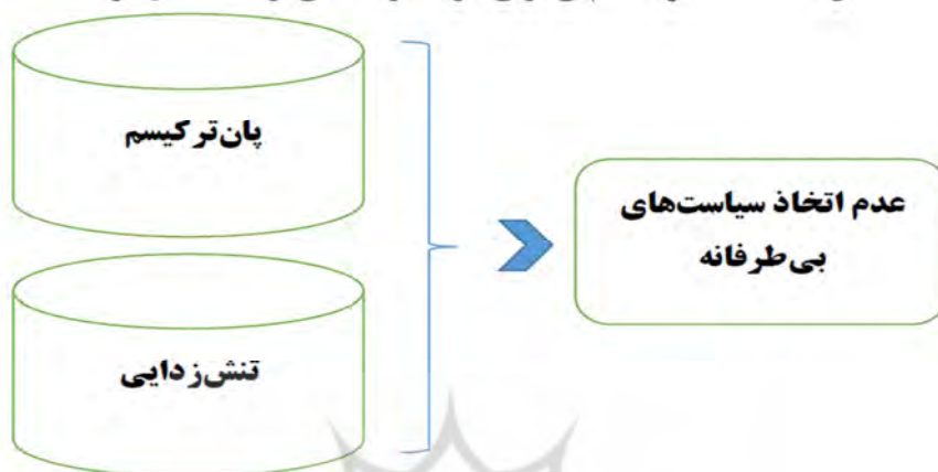
شکل شماره (۴): الگوی عدم بی‌طرفی حزب حرکت ملی ترکیه در قبال ایران

سیاست‌های بی‌طرفانه بر اساس شکل ۴ از سوی حزب حرکت ملی دنبال نمی‌شود. این حزب بر اساس رویکردهای هویتی خویش نمی‌تواند سیاست‌های بی‌طرفانه در قبال جمهوری اسلامی ایران و کشورهای منطقه داشته باشد.