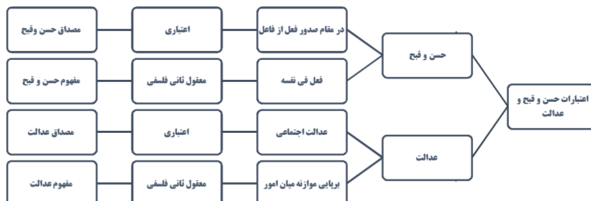
شکل شماره (۱): اعتبارات دوگانه حُسن و قبح و عدالت

داوری عقل درباره مصادیق حُسن و قبح نیز به منزله مفاهیم اعتباری بر اساس تشخیصی است که درباره حُسن و قبح به مثابه معقول ثانی فلسفی می دهد. یعنی اگر دریافت عقل چنین باشد که عمل «الف» به نتیجه «ب» منتهی می شود و از این رو از مصادیق حُسن به معنای معقول ثانی فلسفی است، در این صورت، حُسن عمل «الف» را اعتبار می کند. هم چنین اگر دریافت عقل چنین باشد که عمل «ج» به نتیجه «د» می انجامد و از این رو از مصادیق قبیح به معنای معقول ثانی فلسفی است؛ در این صورت، قبح عمل «ج» را اعتبار می کند. پس قضایای اعتباری یکسان نبوده و از نظر خیر، شر، نفع، ضرر، سعادت، شقاوت، فضیلت، رذیلت، حق و باطل میان آن ها تفاوت است (طباطبایی، ۱۴۲۸ق، ص. ۳۸۵). نتیجه آن که میان مفهوم حُسن و قبح و عدل و میان مصداق آن ها تفاوت است و اولی ثابت و دومی در معرض دگرگونی است. البته می توان مصداق صحیح حُسن و قبح یا عدالت در جوامع گوناگون را در مفهوم «تفکر اجتماعی» یافت (طباطبایی، ۱۳۸۷، ج ۲، صص. ۲۰۸-۲۰۹). بر این اساس می توان تشخیص مصادیق را برعهده «تفکر اجتماعی» دانست. در این «اجتماع فکری»، موضوعات دینی، اجتماعی، خانوادگی و... مورد بررسی قرار گرفته، تفاهم حاصل شده و موضوعات را حل و فصل می کنند (طباطبایی، ۱۴۳۰ق، ج ۱ و ۲، ص. ۳۰۲).