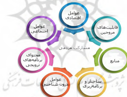
شکل ۱- عوامل مؤثر بر مشارکت‌های مردمی در حفظ، احیاء، توسعه و بهره‌برداری منابع طبیعی (آرایش و فرج اله حسینی، ۱۳۸۹).

مشارکت، حق انسانی است، که به لحاظ غایتی به آزادسازی و اعتماد به خویشتن انسان و از نظر ابزاری، به بسیج و نقش آفرینی توده‌های انسانی در فرایندهای علمی حیات اجتماعی منجر می‌شود و بخش جوهری و اساسی رشد انسان است. آن توسعه خود اعتمادی، ابتکار، سربلندی، فعالیت، مسئولیت‌پذیری و تعاون اجتماعی است. اگر مشارکت را به عنوان کنش اجتماعی در نظر بگیرند، دارای دو جنبه است: ۱- چه انگیزه‌هایی فرد را ترغیب به انجام کنش می‌نماید. ۲- فرد چقدر نسبت به عمل مورد مشارکت آگاهی دارد (سفیری و تمیز، ۱۳۹۰).