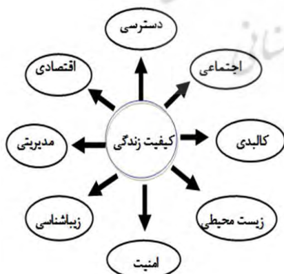
شکل ۲- مولفه های موثر بر کیفیت زندگی شهر (حاتمی نژاد و محمدی کاظم آبادی، ۱۳۹۶)

در میان سازمان های مختلف مدیریت شهری، شهرداری یکی از دستگاه هایی است که ارتباط مداوم و تنگاتنگی با عموم مردم دارد، لذا توسعه همه جانبه و پایدار شهر زمانی عملی خواهد شد که شهروندان از عملکرد شهرداری رضایت داشته باشند. هر شهروند از آغاز تولد تا پایان زندگی نیازمند خدمات این نهاد غیردولتی است. وظایفی نظیر: سیاست گذاری و برنامه ریزی برای توسعه شهری، امور فنی و اجرایی و عمران شهری، وظایف خدماتی، وظایف اجتماعی و فرهنگی و ... همگی از جمله مواردی هستند که بر عهده شهرداری ها و مدیریت شهری می باشد. (حبیبی، کسالایی، افتخاری یوسف آباد و محمدی، ۱۳۹۷)