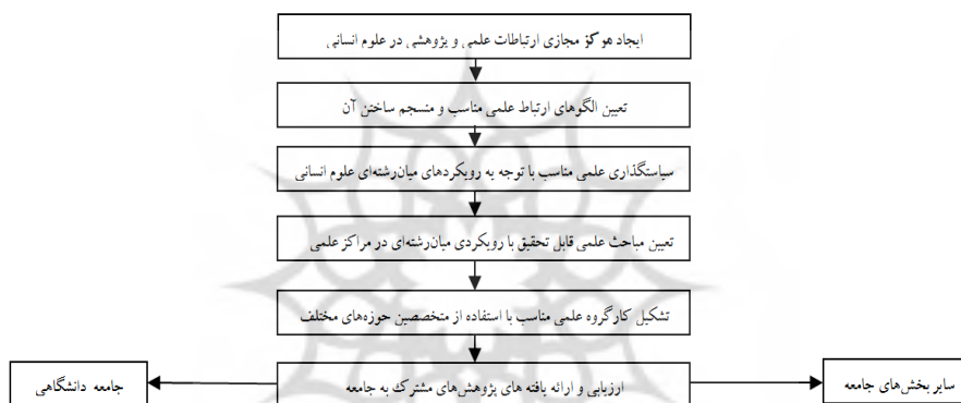
نمودار ۱: برخی از راهکارهای توسعه و تقویت پژوهش‌های میان‌رشته‌ای در علوم انسانی (Fard, 2009; Ryan & Daly, 2018)

حوزه‌های موضوعی آن به هم وابسته و میان‌رشته‌ای است. از این رو، ارائه الگویی دقیق، منسجم و جامع نه غیرممکن بلکه بسیار دشوار است. بر این پایه، تنها به واسطه تکیه بر یک رشته خاص نمی‌توان پاسخ‌گوی روابط پیچیده جوامع دانش‌محور مدرن بود. با توجه به سهم ناچیز انتشارات جهان سوم و کشورهایی از این طیف در تولید دانش در حیطه علوم انسانی به دلایلی از قبیل کمبود منابع پژوهشی، کمبود پژوهشگران زنده و روند رو به کاهش بودجه پژوهشی، لازم است افزون‌بر غلبه بر انزوای پژوهشی و زیرساخت‌های پژوهشی متوسط، بر استفاده از الگوهای ارتباط علمی برای بهبود جایگاه دانشی این جوامع و تبدیل شدن به بخشی از جامعه دانش جهانی تلاش شود. افزون‌بر این، سایر راهکارهای توسعه و تقویت پژوهش، تولید دانش و بهبود جایگاه کشورهای در حال توسعه در فرآیند تولید دانش به‌ویژه در حوزه علوم انسانی بر پایه متون (Roosendaal & Geurts, 1999; Fard, 2009; Ryan & Daly, 2018) را می‌توان در قالب نمودار ۱ با تأکید بر ماهیت میان‌رشته‌ای آن ترسیم کرد: