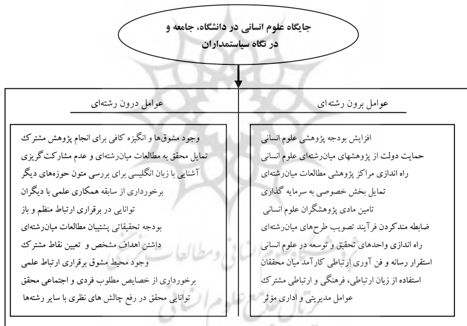
نمودار ۲: برخی از عوامل مؤثر بر تولید علم در علوم انسانی در دانشگاه‌ها