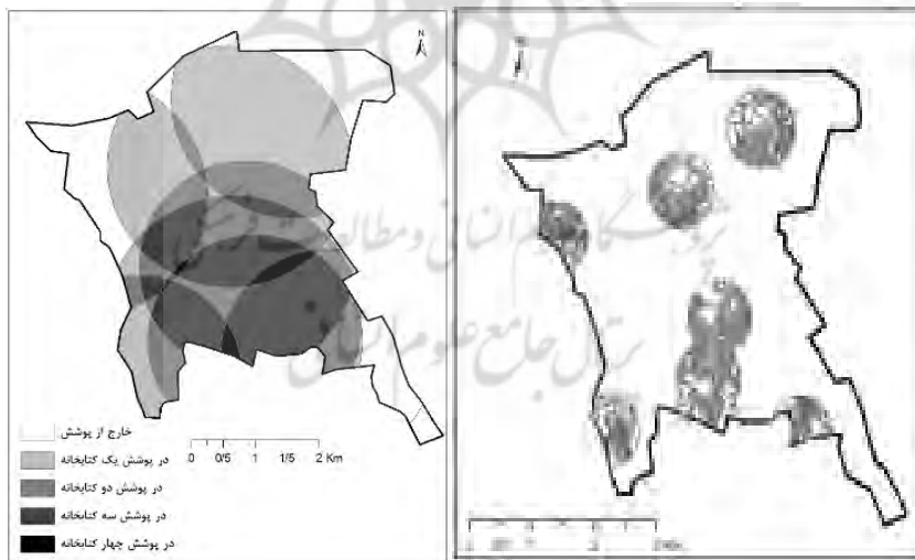
شکل ۵. بلوک‌های جمعیتی ۵۰۰ متری کتابخانه‌ها و هم‌پوشی آن‌ها

محدوده مطالعاتی که در آن ۶۷۳۶۲ نفر (۱۸/۳ درصد از جمعیت) سکونت دارند در حوزه پوشش خدماتی کتابخانه‌های عمومی قرار نمی‌گیرند. همان‌طور که در شکل ۴ آشکار است، قسمت‌های فاقد دسترسی حاشیه‌های جنوب‌غربی، شمال‌غربی و شمال‌شرقی منطقه ۲۰ شهرداری تهران را شامل می‌شود. ۳۵/۷ درصد از مساحت محدوده مطالعاتی که در آن ۲۷/۶ درصد از جمعیت (۱۰۱۴۷۵ نفر) به سر می‌برند، در حوزه پوشش خدماتی فقط یک کتابخانه عمومی قرار دارد. در ۱۹/۷ درصد مساحت که ۸۶۳۷۱ نفر یعنی ۲۳/۵ درصد جمعیت منطقه زندگی می‌کنند، حوزه پوشش خدماتی دو کتابخانه با یکدیگر هم‌پوشانی داشته و ۲۶/۳۹ درصد جمعیت ساکن که در ۵۰۲/۷ هکتار از مساحت محدوده مطالعاتی به سر می‌برند در حوزه دسترسی سه کتابخانه قرار می‌گیرند. در نهایت ۱۵۳۷۱ نفر (۴/۱۸ درصد) از جمعیت محدوده مطالعاتی که در ۳۳۹/۹ هکتار از مساحت منطقه سکونت دارند، تحت حوزه پوشش خدماتی چهار کتابخانه عمومی بوده و در حوزه دسترسی چهار کتابخانه قرار دارند. همچنین، مطابق محاسبات منطبق بر شکل‌های ۴ تا ۶، ۳۷/۱ درصد از جمعیت منطقه، در شعاع حداکثر ۵۰۰ متر از کتابخانه‌های عمومی، ۶۲/۶ درصد در شعاع حداکثر ۷۵۰ متری و ۸۶/۸ درصد در شعاع حداکثر ۱۰۰۰ متر از کتابخانه‌های عمومی سکونت دارند.