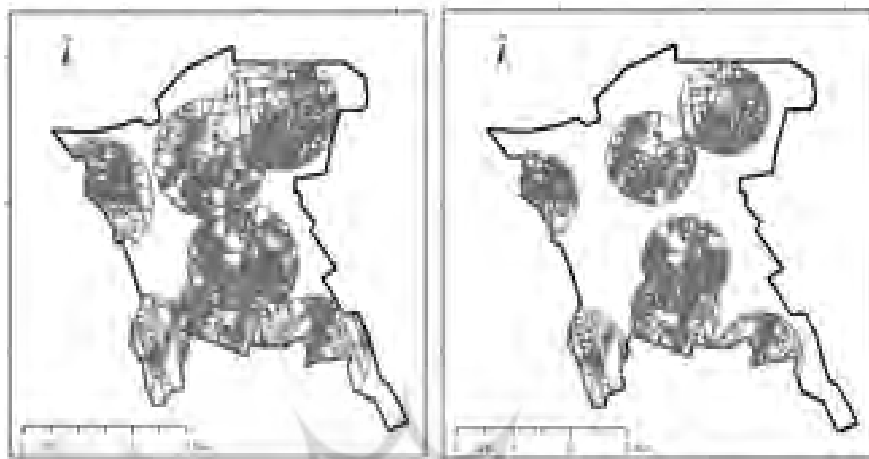
شکل ۶. بلوک‌های جمعیتی ۷۵۰ متری کتابخانه‌ها شکل ۷. بلوک‌های جمعیتی ۱۰۰۰ متری کتابخانه‌ها