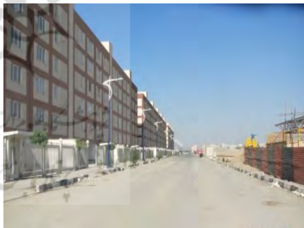
تصویر ۸: اولویت‌دهی به حرکت سواره و نفی هرگونه فضای جمعی و عمومی در ردیف ساختمان‌ها، مسکن مهر تهرانسر. عکس: سینا ناصری، ۱۳۹۴.

حضور در شهر، موجب می‌شود تا لایه‌های مختلفی برای منظر تشخیص داده شود (منصوری، ۱۳۸۹). نوشهرهای مسکن مهر بدون هیچ سابقه سکونت، عاری از هرگونه ردپای تاریخی و رد تعامل انسان با محیط در فضای بیرونی است. از طرفی منظر شهری، مفهوم آن و دستورالعمل‌های اجرایی‌اش هیچ‌گاه در سابقه مطالعات توسعه شهری وجود نداشته و از این‌رو کیفیتی به اسم منظر شهری نیز ایجاد