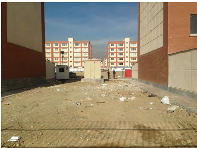
تصویر ۵: عدم تعریف بستر مناسب جهت شکل‌گیری فضاهای اجتماعی.