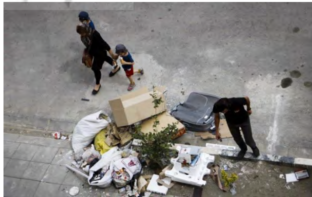
تصویر ۲: عدم وجود زیرساخت‌های مناسب شهری، مسکن مهر تهرانسر.