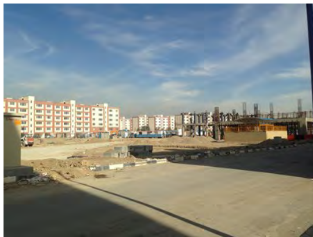
تصویر ۴: تراکم ناموزون، ایجاد یک پهنه خدماتی وسیع و متمرکز و تراکم بالای ساختمانی.

ایجاد رونق‌بخشی و پویایی محیط ایفا می‌کنند. وجود این فضاهای مکث می‌تواند به کنش‌های تعاملی میان ساکنان منجر شود. اما متأسفانه با توجه به فقدان برنامه‌ریزی مناسب در این خصوص و توجه به استفاده حداکثری از اراضی جهت جانمایی بیشینه تعداد واحدهای مسکونی، این اصل مهم به دست فراموشی سپرده شده و آنچه از عرصه باقی می‌ماند به عنوان مسیرهای ارتباطی با الویت حرکت سواره اختصاص داده می‌شوند، و عملاً فضاهای انسان محور، که شرط لازم ارتقای سطح کیفی فضا هستند در برنامه طراحی جایی ندارند (تصویر ۸).