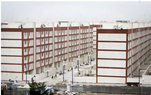
تصویر ۳: بلوک‌های ساختمانی یک شکل بدون هیچ شاخصه‌ای جهت ایجاد تمایز موجبات بی‌روحي فضا را به دنبال داشته است، مسکن مهر تهرانسر.

یکی دیگر از ابعاد آسیب‌شناسانه کالبدی طرح، عدم تنوع کاربری‌ها و تک‌عملکردی بودن محوطه این