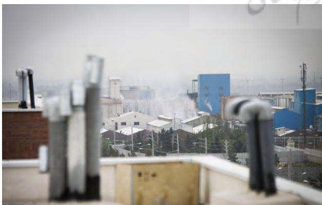
تصویر ۶: قرارگیری سایت مسکن مهر تهرانسر در پهنه صنعتی شهر. مجاورت این پروژه با کارخانجات مشکلاتی را برای ساکنان رقم زده است.

منظر شهر، ادراک شهروندان از شهر است که از خلال نمادهای آن به دست می‌آید؛ وابستگی فهم منظر به سابقه