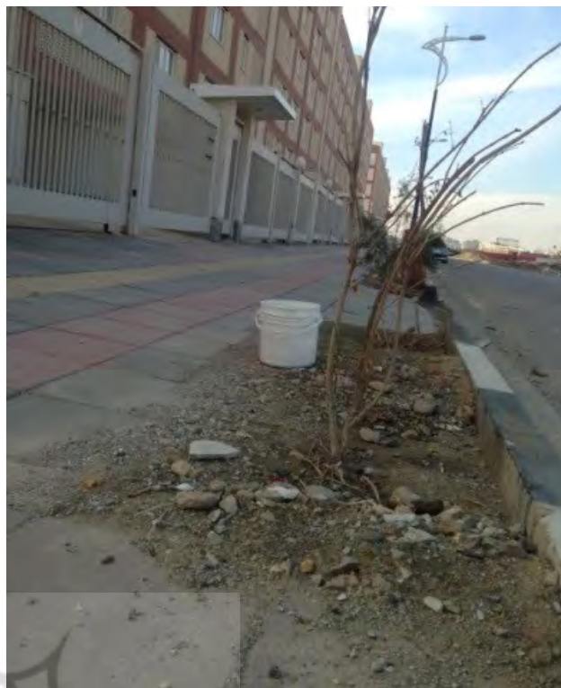
تصویر ۷: کاشت حداقلی درخت و تعبیر فضای سبز از آن به زعم طراحان، مسکن مهر تهرانسر. عکس: سینا ناصری، ۱۳۹۴.

با توجه به بررسی آسیب‌شناسانه انجام‌شده در طرح مسکن مهر و نواقصی که شرح داده شد، به نظر می‌رسد ملاک عمل در طراحی این پروژه جای‌گذاری حداکثری بلوک‌های مسکونی و استفاده بیشینه و نه بهینه از سرانه فضایی جهت تأمین حداکثر تعداد واحدهای مسکونی بوده است. در این میان جنبه‌های کیفی زندگی ساکنان هم در بُعد اجتماعی و هم در بُعد کالبدی، اعم از دید و منظر، ایجاد روابط اجتماعی و امکان بازتولید خاطره جمعی، به دست فراموشی سپرده شده است. این الگو تا به امروز نتیجه‌ای جز تولید فضاهای بی‌هویت، بی‌شکل، فاقد قلمرو، بی‌روح، یکنواخت و فاقد سازمان مشخص فضایی، دربر نداشته است. نگرش دانش منظر به مقوله پروژه‌های مسکن انبوه و محیط پیرامونی، نگرشی همگام با برنامه‌ریزی همه‌جانبه‌نگر و انعطاف‌پذیر است که به جای تمرکز یک بُعدی و بخشی، با تلفیق لایه‌های مختلف فضایی و کالبدی، به دنبال رهیافتی جهت شکل‌دهی پروژه با رویکرد منظرین دو گانه تنوع-تکثر هم‌درفضاسازی و هم‌منظره‌سازی در مقابل یکنواختی حداکثری موجود است که هرگونه فردیت را نفی می‌کند. برون‌رفت از وضع کنونی در گروهی توجه به اقدامات عملی منتج از رویکرد منظرین پروژه در راستای حیات‌بخشی مجدد و بازیابی هویت جمعی ساکنان و ایجاد انگیزش جهت مانایی در مکان خواهد بود. لذا اقدامات زیر می‌تواند منتج از رویکرد منظر به عنوان