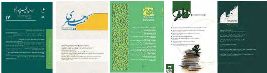
تصویر ۲. روی جلد برخی مجلات علمی - پژوهشی هنر

هجده گانه جدول (۱) دیده نمی‌شوند. مقاله‌ای در حوزه هنر یافت نشد تا بتوان نتایج آن را با مطالعه حاضر مقایسه کرد. اما، یافته‌های حاصل از این پژوهش تنها با یکی از مطالعات انجام‌شده در حوزه علوم انسانی قابل‌مقایسه است. در مقایسه یافته‌های به‌دست‌آمده از مطالعه اخیر با پژوهش افشاری و همکاران (۱۳۹۲)، از مجموع ۳۵ کاربرد ارزیابی مجلات علوم انسانی ۴۱ شاخص و از مجموع ۹ کاربرد مجلات هنر ۵۳ شاخص شناسایی و استخراج شد؛ اما هر دو گروه از ۱۱ مؤلفه برای ارزیابی مقالات علمی خود استفاده می‌کنند. در این مقایسه، بیشترین توجه کاربردهای ارزیابی حوزه علوم انسانی به مؤلفه «روش تحقیق» و کمترین توجه به مؤلفه «محتوا» است؛ اما طبق یافته‌های پیشین، در کاربردهای ارزیابی هنر شرایط به گونه دیگری است. سایر پژوهش‌هایی که در پیشینه تحقیق به آن‌ها اشاره شد، بیشتر به‌صورت نقادانه به مسئله داوری، کاربردهای ارزیابی و نیز شاخص‌های موجود در آن‌ها توجه نموده‌اند؛ درحالی‌که هدف این مطالعه تأکید بر ضرورت لحاظ نمودن مؤلفه‌های نگارش مقاله علمی در کاربردهای ارزیابی مجلات تخصصی حوزه هنر است. در هر صورت، مرور سوابق پژوهش گواه این مطلب است که، تاکنون به‌عنوان پژوهشی از نوع کاربردی به سنجش کاربردهای ارزیابی این حوزه از علم هیچ‌گونه توجهی نشده است.