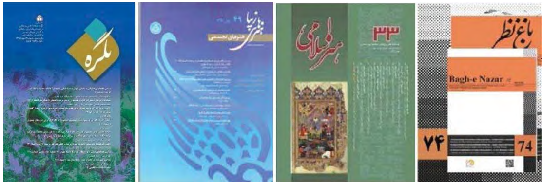
تصویر ۱. روی جلد برخی مجلات علمی-پژوهشی هنر