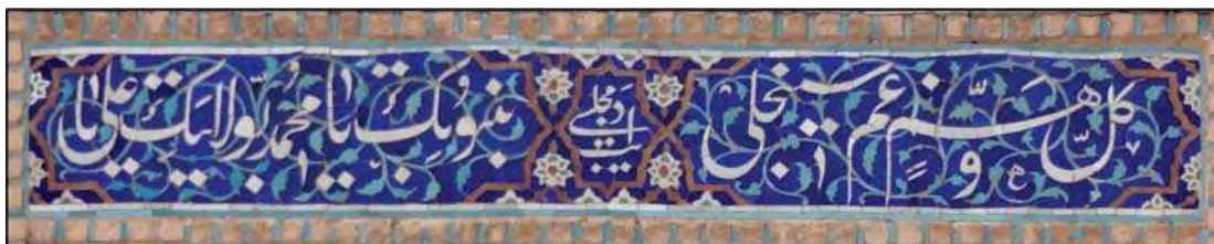
تصویر ۷. کتیبه کاشی معرق طرفین ورودی مسجد امام اصفهان، حاوی رقم: «ادیب مجلسی»

۱۳۷۸: ۳۶ - قلیچ خانی، ۱۳۸۶: ۶۱-۶۳ - هراتی، ۱۳۸۶: ۶ - خسروی بیژانم و یزدانی، ۱۳۹۰: ۶).