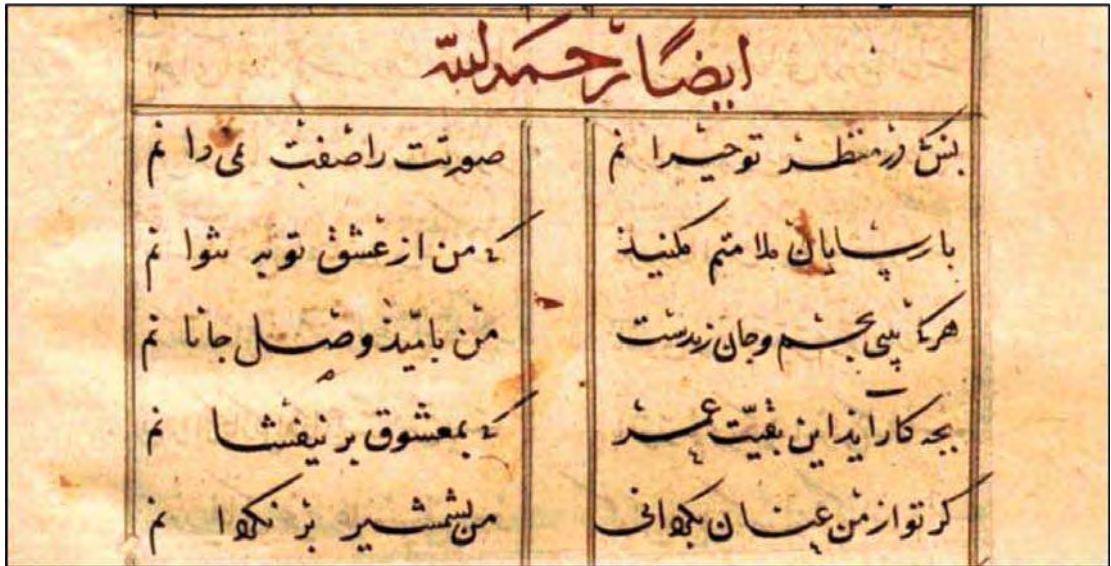
تصویر ۱: نمونه‌ای از نستعلیق اولیه، کلیات سعدی، ۷۸۴ ه.ق، ثبت شده در میراث جهانی یونسکو،