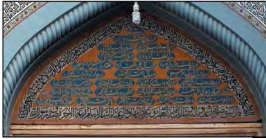
تصویر ۶. کتیبه حجاری سردر ایوان شرقی صحن عتیق حرم مطهر رضوی، حاوی رقم: «نمقه عبدالله» در گوشه سمت چپ کتیبه.