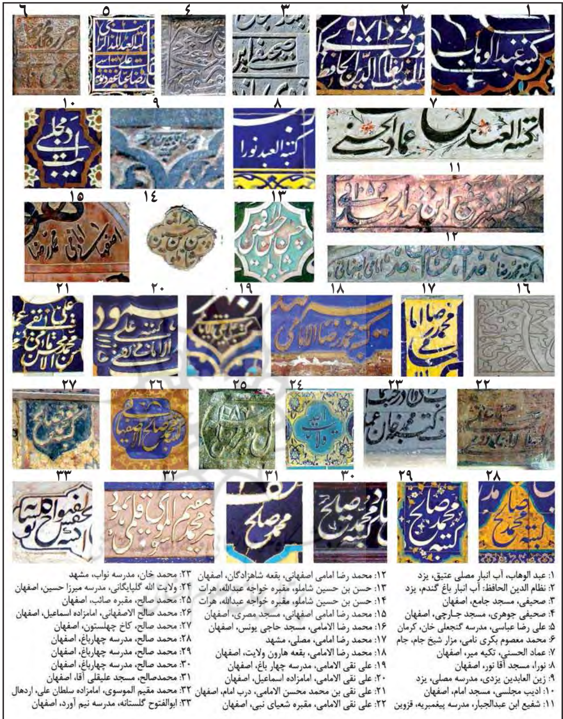
تصویر ۳. برخی از رقم‌های موجود در نمونه‌های جامعه آماری

توانایی شگفتی در نستعلیق خفی داشت. شاگرد او سلطان محمد نور نیز در همنشین کردن نستعلیق خفی و جلی مهارت داشت (سوچک، ۱۳۸۶: ۲۴ و ۳۱). خوشنویسان برجسته، مانند خطاطان دربار ابراهیم میرزا (وفات ۸۳۸ ه.ق.)، بایسنقر میرزا (وفات ۸۳۷ ه.ق.) و شاه طهماسب (حکومت ۹۳۰-۹۸۳ ه.ق.)، بارها در طراحی