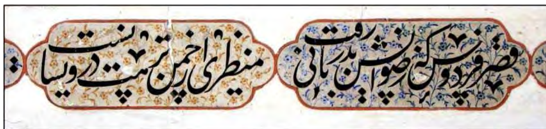
تصویر ۲. تکیه میر اصفهان، بخشی از کتیبه به قلم میر عماد

پس از میرعلی تبریزی، پسرش میرعبدالله و بعد از او میرزا جعفر تبریزی و اظهر تبریزی، در تکامل قلم نستعلیق کوشش‌ها کردند، تا نوبت به سلطان‌علی مشهدی، معروف به «قبله الکتاب» (عالی افندی، ۱۳۶۹: ۶۱) رسید. اساتید زیادی پس از جعفر و سلطان‌علی، در تکامل تدریجی نستعلیق موثر بودند، همانند میرعلی هروی و سپس بعد از حدود یک قرن، میرعماد حسنی (ف ۱۰۲۴ هـ ق). دقیقاً همین نکته که در قلم نستعلیق تکامل