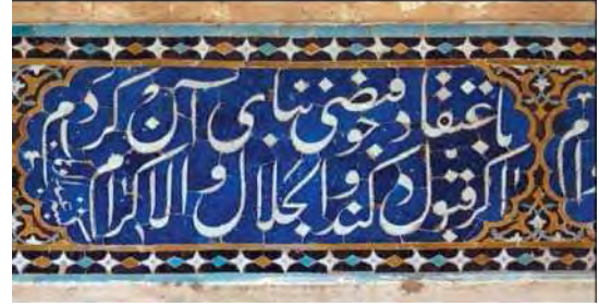
تصویر ۵. کتیبه کاشی معرق سردر آب انبار مصلی عتیق یزد، حاوی رقم: «کتبه عبدالوهاب».

حافظ که در تکیه میر اصفهان اجرا شده و در آخرین قاب‌بندی، رقم «کتبه العبد عماد الحسنی» را بر خود دارد (روح‌الامین: ۱۳۸۶: ۱۵۳). «در زمان میر، اکبر شاه هندی از هندوستان به دیدن شاه عباس آمد. هنگام مراجعت از صنایع اصفهان هر کدام چیزی خواست، من جمله از خطوط میر هم غزل معروف خواجه را، روضه خلد برین خلوت درویشان است، به طور کتیبه که به خط میر نوشته شده بود، جزو هدایا به او دادند، برد هندوستان. بعد از روی آن کرده برداشته آوردند در تکیه میر که هنوز باقی است» (اصفهانی، ۱۳۹۱: ۳۲۱) (تصویر ۲).