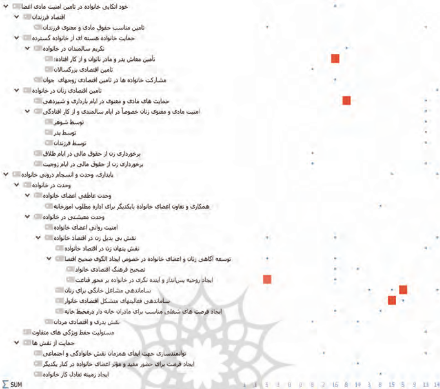
شکل ۱. مضامین پژوهش

در این پژوهش، کدگذاری در یک مرحله با مطالعه سطر به سطر سیاست‌ها و به صورت دستی انجام شد و در مرحله دیگر کدگذاری با استفاده از نرم‌افزار MAXQDA12 انجام شد. سپس، نتایج این دو کدگذاری با یکدیگر مقایسه و از روش هولستی برای محاسبه پایایی استفاده شد (عابدی جعفری و دیگران، ۱۳۹۰: ۱۸۹)، که فرمول آن عبارت است از: