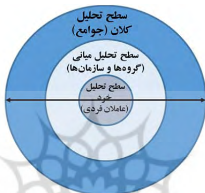
شکل ۳. سطوح تحلیل سرمایه اجتماعی

شناسایی شاخص‌های مفهوم سرمایه اجتماعی و دسته‌بندی آن‌ها در قالب ۱۴ مقوله فرعی و جایگیری آن‌ها ذیل سه مقوله اصلی سرمایه اجتماعی بود. با بررسی کدهای استخراج شده و تجمیع آن‌ها در قالب مقوله‌های فرعی و اصلی، می‌توان سطوح تحلیل مفهوم سرمایه اجتماعی را در سه سطح کلان (Macro level) (سطح جوامع)، میانی (Meso level) (سطح گروه‌ها یا سازمان‌ها) و خرد (Micro level) (سطح عواملان فردی) در قالب شکل ۳ احصا کرد.