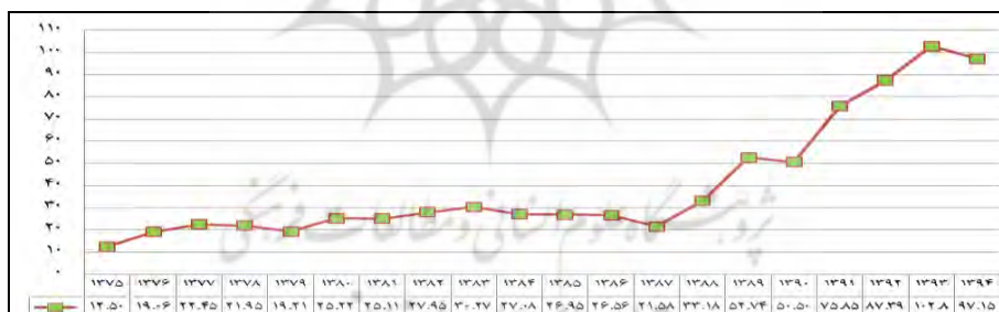
نمودار ۲. میزان سرقت در هر ۱۰ هزار نفر جمعیت، سال ۱۳۷۵-۱۳۹۴

براساس آمار مرکز آمار ایران، در طول ۲۰ سال بررسی‌شده در این پژوهش (۱۳۷۵-۱۳۹۴):