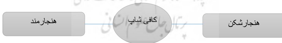
شکل ۲: تیپولوژی کافی‌شاپ‌های بندرعباس

همانگونه که اشاره شد شهر بندرعباس دارای کافی‌شاپ‌هایی است که به نحوی نسبت به جامعه و نظام کنونی حاکم بر آن، هنجارشکن هستند و از آنها با عنوان کافه‌های هنجارشکن نام برده شد. در این کافی‌شاپ‌ها آنچه اساس و پایه‌ی رونق است، قلیان است. از طرف دیگر آنچه در کافه‌های سنتی و قهوه‌خانه‌ها از گذشته تا به امروز رواج داشته و نقش مهمی در استحکام قهوه‌خانه‌ها داشته، همین قلیان بوده است اما آنچه جالب به نظر می‌رسد نفوذ این بعد از سنت در فضای مدرن کافی‌شاپ است. در واقع قلیان، سنت و مدرنیته را در فضای کافی‌شاپ ادغام ساخته است. کافی‌شاپ مدرن کنونی با وجود داشتن هنر و سبکی مدرن، قلیان را به عنوان یکی از مهم‌ترین عناصر خود، در فضای کنونی‌اش جای داده است. در واقع استعمال قلیان می‌تواند به خودی خود یکی از بنیادی‌ترین اهداف کافه‌روها برای حضور در کافی‌شاپ‌های هنجارشکن باشد.