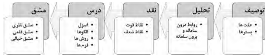
تصویر ۲: نمودار مسیر خواندن معماری Fig. 2: Steps of reading process

۲- مرحله حضور، به روش مطالعه میدانی و با هدف خواندن معماری از طریق حضور در بنا و درک و کشف ویژگی‌های کالبدی و معنایی آن و مقایسه تطبیقی عناصر مشابه با یکدیگر در آثار مختلف انجام می‌گیرد. این مرحله درک درست و همه‌جانبه‌ای از ویژگی‌های صوری و معنایی اثر معماری (سیرت و صورت اثر) و نیز ارتباط آن با بسترهای پیرامونی آن به محقق می‌دهد و امکان تحلیل مؤثرتر و نقد صحیح‌تر بنا را فراهم می‌آورد. روش ادراک و کشف کیفیات مکان در این مرحله را به ترتیب می‌توان شامل: سکوت و حضور و درک بنا توسط همه حواس پنجگانه (مشق نظری)، کروکی و مشق کردن (مشق قلمی)، تصویربرداری و هم‌فکری با پژوهشگران دانست. همچنین در این مرحله می‌توان با روش‌های پرسشنامه یا مصاحبه از ساکنان یا شهروندان پیرامون بنا یا دست‌اندرکاران اداره مجموعه نیز اطلاعات مفیدی به دست آورد.