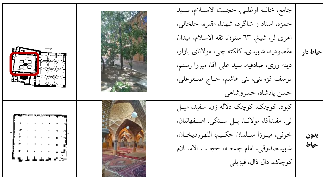
جدول ۱۳: دسته بندی نمونه ها بر اساس حیاط