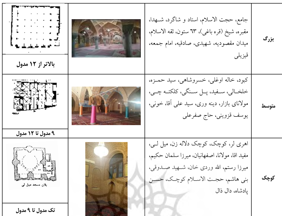
جدول ۶: دسته بندی نمونه ها بر اساس اندازه

مورد استفاده می باشد. در این نمونه ها هر چند مدول مسجد مشابه گروه اندازه کوچک است، لیکن سطح نمونه بزرگ تر بوده و فضای بیشتری برای استفاده فراهم می آورد.