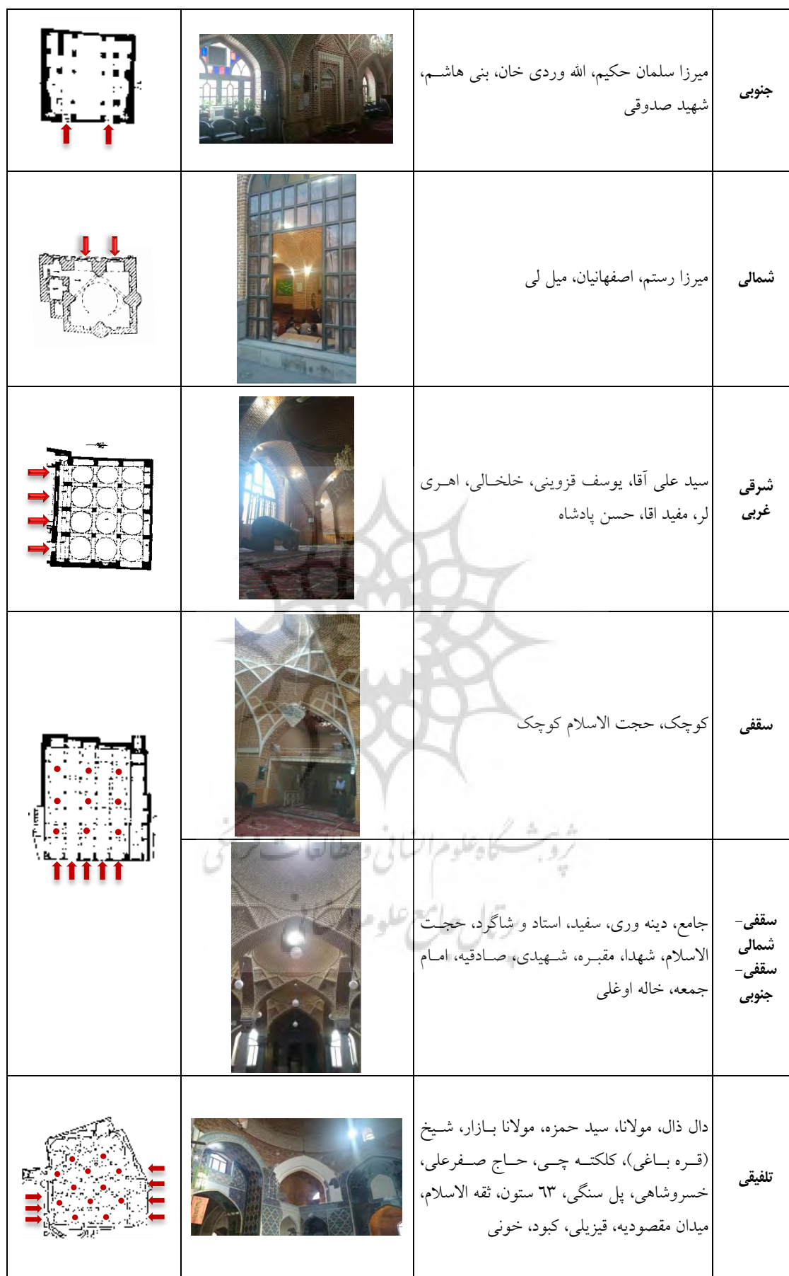
جدول ۱۲: دسته بندی نمونه ها بر اساس ورودی