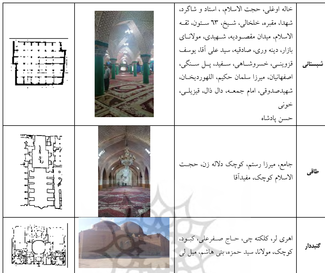
جدول ۸: دسته بندی نمونه ها بر اساس ساختار معماری

نمونه در ذیل چند آیتم مطرح می شوند و این به این معناست که نمونه موردنظر شامل تزیینات از تمام آیتم های مذکور می باشد. به عنوان مثال مسجد قیزیلی در مدول محراب خود صرفاً از کاربردی ساده به عنوان تزیین استفاده نموده و بنابراین در ذیل هر دو ردیف کاربردی ساده و تزیین مدول محراب گنجانده شده است.