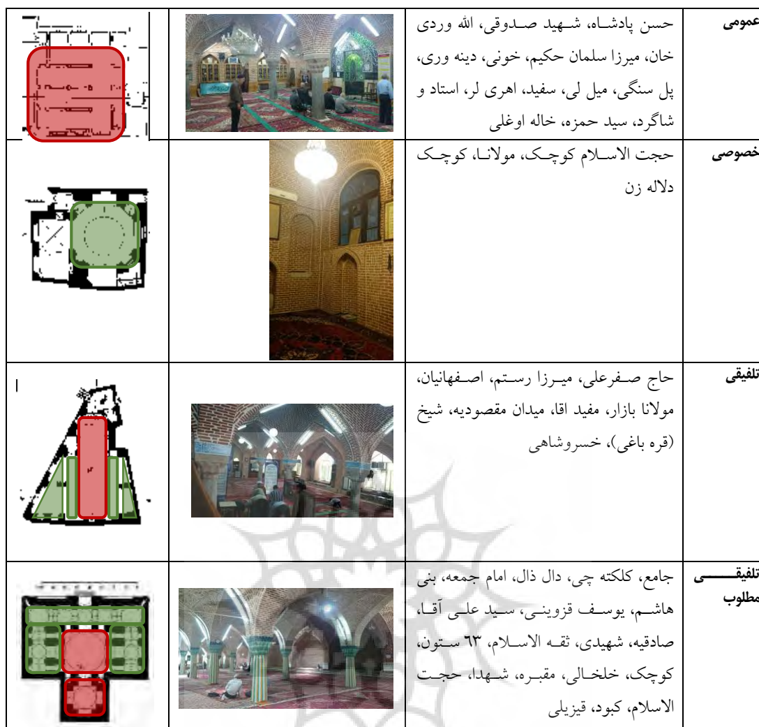
جدول ۵: دسته بندی نمونه ها بر اساس عرصه بندی

و به دلیل ادراکی بودن بحث، نظر صرف محقق نمی تواند کامل و کافی باشد و لذا تحلیل این بخش حاصل تلفیق نظر کاربران، تحلیل رفتار آن ها و مشاهده محقق می باشد. در جدول شماره ۵ عرصه های عمومی با رنگ قرمز و عرصه بندی خصوصی به رنگ سبز نشان داده شده است.