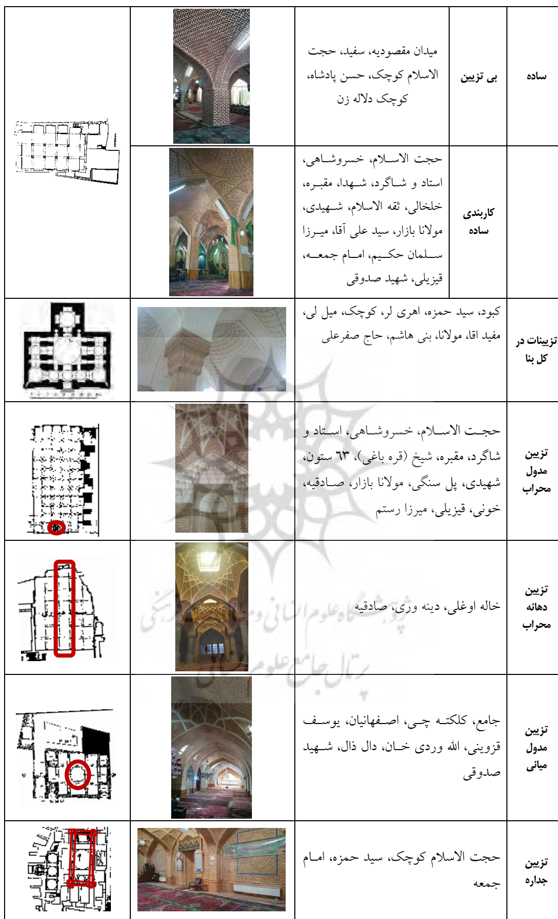
جدول ۱۰: دسته بندی نمونه ها بر اساس مصالح