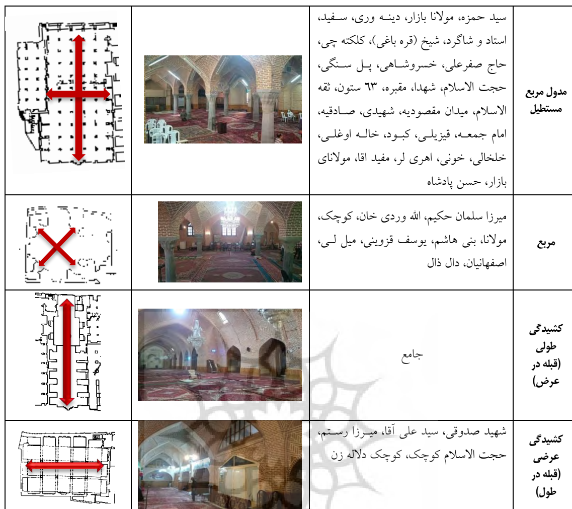
جدول ۷: دسته بندی نمونه ها بر اساس شاکله داخلی

پیوستن طاق ها، فضای اصلی خود را ساماندهی نموده اند و مساجد گنبددار نمونه هایی هستند که وجود گنبد در آن ها شاخص است، خواه ساختار طاق و گنبد داشته باشند و خواه چیدمان آن ها همچون نمونه های شبستانی باشد. در این نمونه ها، امر شاخص وجود گنبد است و همین امر سبب دسته بندی آن ها در گروهی مخصوص به خود شده است. لازم بذکر است ساختار مسجد حسن پادشاه که به دلیل مرمت کاملاً متفاوت با ساختار اصلی، قابل تشخیص نیست؛ به نظر می رسد جزو نمونه های شبستانی با سه ستون و ۹ گنبد کوچک باشد.