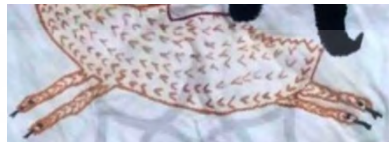
شکل ۴: بدن و پاهای شاماران، بخشی از تصویر ۳

اثر، به جای سُم چهارپایان، سر مار را بر انتهای دست و پا نقش کرده است. دست‌ها و پاها کاملاً باز و در جهت مخالف همدیگر تصویر شده‌اند که سبب القای حرکت یورتمه شاماران در ذهن بیننده می‌شود. مارها به گونه‌ای که آماده دفاع از جان خود هستند، نیششان را بیرون آورده‌اند. بافت بدن در این قسمت با دوخت متفاوتی جدا شده است. این در حالی است که در بیشتر موارد شاماران با تعداد بیشتری از دست و پا نشان داده می‌شود که حالت سکون یا حرکت آهسته را نشان می‌دهند؛ اما در فرم دست و پاها که به شکل مار ترسیم می‌شوند مشترک هستند. در قسمت بدن در هیچ‌کدام از تصاویر مشاهده شده به حالت نر و مادگی شاماران اشاره نشده است و تنها از روی سر آن جنسیت تشخیص داده می‌شود و بافت تصویر شده برای بدن، دست و پا مشابه است.