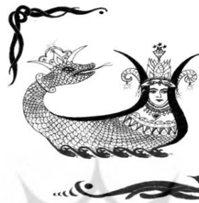
شکل ۱: اسطوره شاماران (Barzan, 1993: 38)

شاماران را سه قسمت کنند. وزیر دمش را می خورد و سر شاماران را به خورد تامه سپ می دهد و دستور می دهد بدن شاماران را برای پادشاه کباب کنند. وزیر حریص درجا می میرد؛ زیرا شاماران واقعیت را نگفته بود. پادشاه سلامتی اش را باز می یابد و تامه سپ به تمام رازهای نهانی جهان آگاه می شود. تامه سپ، لقمان حکیم می شود، کسی که تمام گیاهان، رازهای پزشکی شان را به او می گویند.