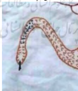
شکل ۷: دم شاماران، بخشی از تصویر ۳

انتهای دم شاماران به شکل ماری است (شکل شماره ۷) که نیشش را بیرون آورده است. بافت دم شاماران، با دوختی ناپیوسته مشخص شده است و رنگ آن قهوه‌ای است؛ اما قسمتی از آن مشکی است و نکته مهم در تمام تصاویر شاماران، گردن مار است که دارای حلقه است. این حلقه بیشتر با رنگی متفاوت نشان داده می‌شود. در این تصویر، حلقه گردن و نیش مار به رنگ مشکی است. در بیشتر موارد قسمت دم شاماران با نیشی باز و متحرک رو به سمت شاماران ترسیم می‌شود؛ اما در این دستمال دم با نیشی بیرون آمده به رنگ سیاه و در جهت مخالف سر و به سمت پایین ترسیم شده است که یادآور فرم دم اسبی در حال یورتمه است که احتمالاً این تفاوت در ترسیم جهت و فرم دم، به دلیل القای حرکت در این دستمال خاص بوده است.