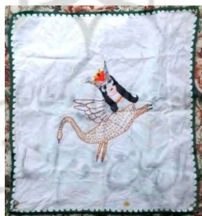
شکل ۳: دستمال تزئینی شاماران