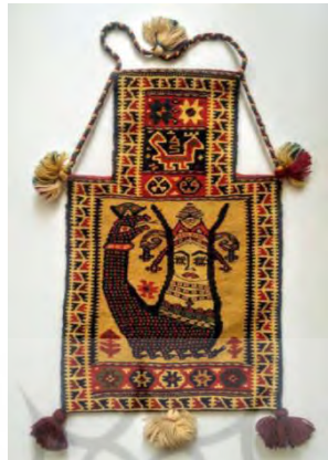
شکل ۱۰: کیسه تزئینی نگهداری نمک با نقش شاماران (عکس: نگارندگان، شهرستان مهاباد، متعلق به سال ۱۳۹۰)

در هنر بین‌النهرین معمولاً اژدر و اژدر - مار به‌عنوان محافظ دروازه‌ها، چشمه‌های آب حیات و بی‌مرگی و قداست و نیز همه نشانه‌ها و علائم مربوط به زندگی، باروری، قهرمانی، بیماری و گنجینه‌ها به‌شمار می‌روند (الیاده، ۱۳۷۲).