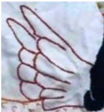
شکل ۵: بال‌های شاماران، بخشی از تصویر ۳

در شکل شماره پنج، بال‌های بسته، ارتباط موجودات الهی و مافوق طبیعی را با اسطوره شاماران نشان می‌دهد. بر اساس تحقیق احمد اقتداری ۱ ، کبوتر از نشانه‌های زهره (آناهیتا) است (همان‌جا).