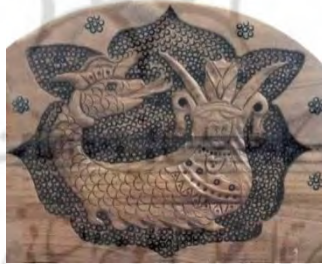
شکل ۲: کنده کاری نقش شاماران روی تختخواب (عکس: نگارندگان، شهرستان مهاباد، متعلق به

این داستان روایتی کلی است از ماجرای این حیوان ترکیبی و اسطوره ای که در روستاهای مختلف و برخی مناطق شهری منطقه مکران به مرکزیت مهاباد از پدران و مادران برای فرزندان نقل می شود و در مناطق مختلف با برخی جزئیات متفاوت بیان تصویر می شود؛ ولی کلیت ماجرا و شکل آن ثابت است (شکل شماره ۲).