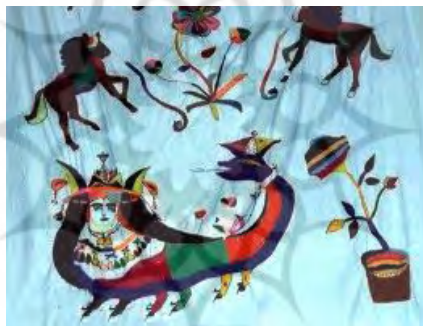
شکل ۱۱: پرده منقوش با تصویر شاماران (عکس: نگارندگان، روستای لچ، متعلق به سال ۱۳۶۰)

نقش مار در کردستان، بیش از هر چیز دربردارنده مفاهیمی چون نیروهای جهان زیرین، نامیرایی و باروری است و بیش از هر فرهنگ و تمدن دیگری با آیین‌های منطقه خود مرتبط است. هم با نوعی تقدس و احترام همراه است هم با وحشت. رابطه انسان و مار در هیبت شاماران شکل جدیدی به‌خود می‌گیرد که اتفاقاً همچون گذشته خطرناک نیست و از دوستان انسان به‌شمار می‌آید. شاماران نماد دوستی، محافظت پیمان و خوش‌یمنی است (شکل شماره ۱۰).