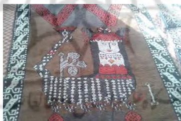
شکل ۹: گلیم و قالی دارای نقش شاماران (عکس: نگارندگان، روستای دریاس، متعلق به سال ۱۳۸۴)

مارهایی با سر انسان، گواهی بر جنبه الوهیت این خزنده به‌دست می‌دهند (هینتس، ۱۳۷۱). به‌نظر می‌رسد این پرستش خدایان، به‌مرور زمان منسوخ شده و چهره‌ای مرموز داشته است. گاهی نمادی از نیروهای سودبخش بوده است و حاصلخیزی و برکت را به همراه می‌آورده و گاهی نیز نشانه‌ای از نیروی هولناک بوده است که ویران‌کننده و مصیبت‌آور است. وجود این نقش‌مایه در زیر پی‌بناها دلالت بر آن دارد که برای دفع چشم‌زخم و دوری از نیروهای شوم موجود در قلمرو عالم زیرین به‌کار می‌رفته است.