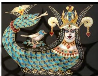
شکل ۸: تابلوی دیواری شاماران (عکس: نگارندگان، روستای لچ، مکریان مهاباد)

تاریخ پیدایش شاماران به روشنی مشخص نیست؛ اما در تمامی روایت‌ها هدف از کشته شدن شاماران، بهبودی، شفا و یافتن آگاهی انسان است. این افسانه در بین اقوام گُرد، درمانگر بودن شاماران و آگاهی او به رازهای جهان را بیان می‌کند. در نقوش و بافته‌های مردم این منطقه، شاماران اسطوره‌ای ترکیبی بین زن و مار است. مردم این روستا معتقدند شاماران روزی آن‌ها را فزونی می‌بخشد. به همین دلیل خانه‌هایی را برای زندگی انتخاب می‌کنند که در اطرافشان مارها دیده شده باشند. گاهی مردم، بال پرندگان را هم برای شاماران متصور می‌شدند (شکل شماره ۸).