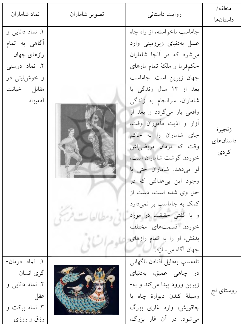
جدول ۱: مقایسه روایت‌های شاماران در مناطق مختلف مکران (نگارندگان)

تفاوت‌هایی اندک مشاهده می‌شود؛ اما هدف و انگیزه اصلی از خلق و بیان این اسطوره و داستان افسانه‌ای یکی است (جدول شماره ۱).