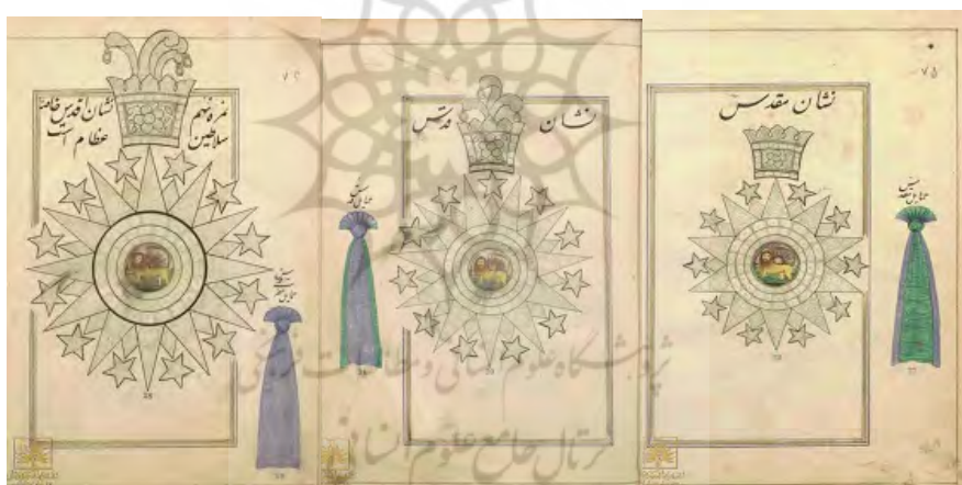
(نشان‌های اقدس، قدس و مقدس در عصر ناصرالدین‌شاه) ۴

برای سایر طبقات که خارجی‌ها و حتی نظامی‌ها هم از روی نشان «لژیون دونور» فرانسه نشان پنج‌درجه‌ای به اسم نشان شیر و خورشید برقرار کرد که درجه اول آن با حمایل سبز بود. اما نشان اقدس و قدس به حال خود باقی ماند و در حقیقت، نشان درجه اول شیر و خورشید جای نشان مقدس را گرفت و نظامنامه‌ای برای هر یک نوشت و در اعطای نشان و رتبه نظامی بسیار کفید می‌کرد. ۳