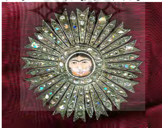
نشان آفتاب مخصوص بانوان ابداع‌شده در عصر ناصرالدین‌شاه

نشان آفتاب، نشان رشادت، نشان افتخار، نشان یادگار سال پنجاهم سلطنت، نشان ذوالقرنین و نشان ناصری از جمله دیگر نشان‌های ابداع‌شده در دوره سلطنت ناصرالدین‌شاه هستند. ۳ نشان آفتاب در عصر مظفری نیز کاربرد داشته است برای نمونه در سال ۱۳۱۴ق، به زوجه شمس‌الدین بیک سفیر دولت عثمانی از جانب مظفرالدین‌شاه یک قطعه «نشان آفتاب» اهدا شد. ۴