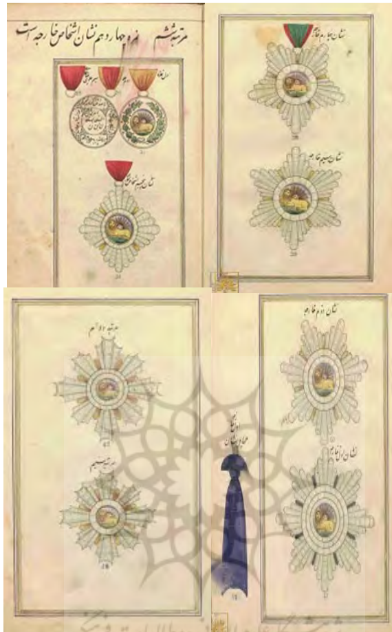
(نشان‌های مخصوص خارجیان در عصر ناصرالدین‌شاه) ۱