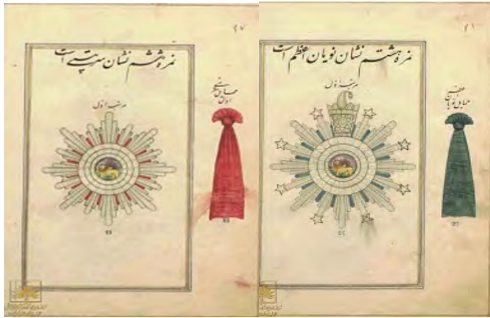
نشان‌های مخصوص نظامیان در عصر ناصرالدین‌شاه ۱