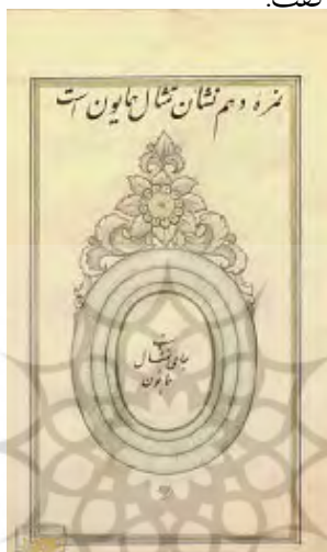
قالب تمثال همایون در عصر ناصرالدین شاه ۴

واسطه گری در امر تفویض نشان تنها مختص نشان های نظامی نبود، بلکه تمثال هم بدین گونه دستاویز طمع برخی قرار گرفته بود. عین السلطنه این واسطه گری ها در امر تفویض تمثال را علامت انقراض و ضعف سلطنت می داند. ۲ وضع چنان آشفته شده بود که دیگر شاه با میل و رضایت قلبی به کسی امتیاز نمی داد و به قدری از این وضعیت به ستوه آمده بود که در هنگام اعطای تمثال ناسزا می گفت. ۳