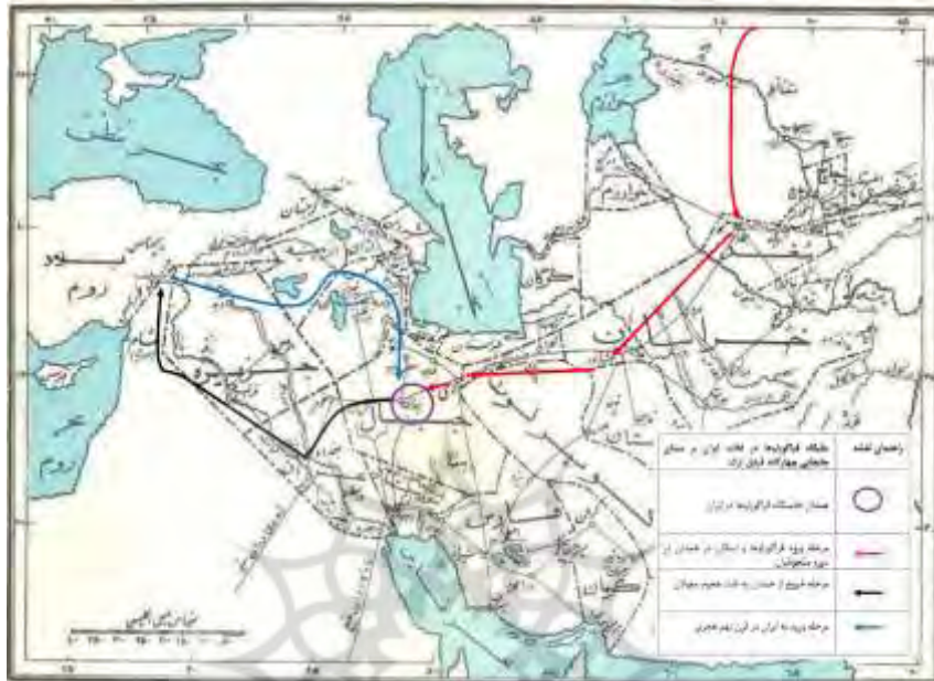
(نقشه شماره دو: لسترنج، ۱۳۷۷: ۸)