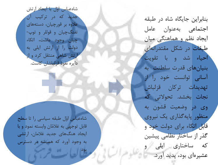
شکل (۴): تغییر در تشکیلات نظامی و تقویت بنیان‌های قدرت سلطنت در عصر شاه‌عباس اول

اقتصادی بود. شاه‌عباس شماری از فرماندهان لشکری قزلباش را عزل کرد و غلامان شاهی گرجی، چرکس قفقازی و ارمنی را به خدمت گرفت. این گروه منزلت و منافع خویش را با وفاداری مستقیم به شاه‌عباس، حضور در دربار سلطنتی و به‌دست آوردن مناصب سیاسی و نظامی جایگاه مشخصی در میان طبقات اجتماعی به‌دست آوردند (شاردن، ۱۳۴۵، ج ۴/ ۳۶۷). شاه‌عباس تغییراتی ساختاری در مبانی قدرت مالی و جنگی قزلباشان ایجاد کرد، اما در لشکرکشی‌های خویش همچنان بر آنان اتکا داشت. روند به کارگیری غلامان در سپاه صفویان که عمدتاً از اسرای گرجی بودند از دوران شاه‌تهماسپ آغاز گردید، اما به صورتی منظم و آگاهانه در دوره شاه‌عباس به اوج خود رسید (ترکمان، ۱۳۵۰، ج ۱/ ۱۴۰-۱۳۹).