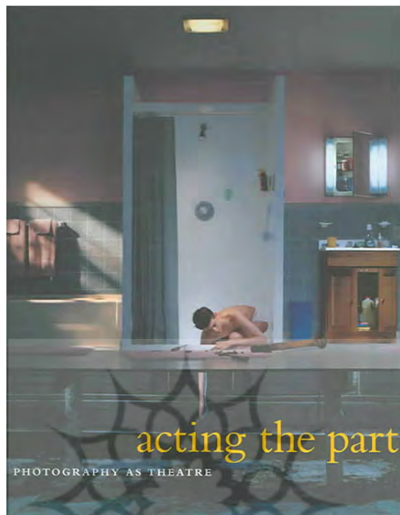
تصویر ۱. تصویر جلد کتاب اصلی

عکاسی به‌مثابه عملی تئاتری؛ تحلیل و بررسی کتاب صحنه‌آرایی ... ۴۵