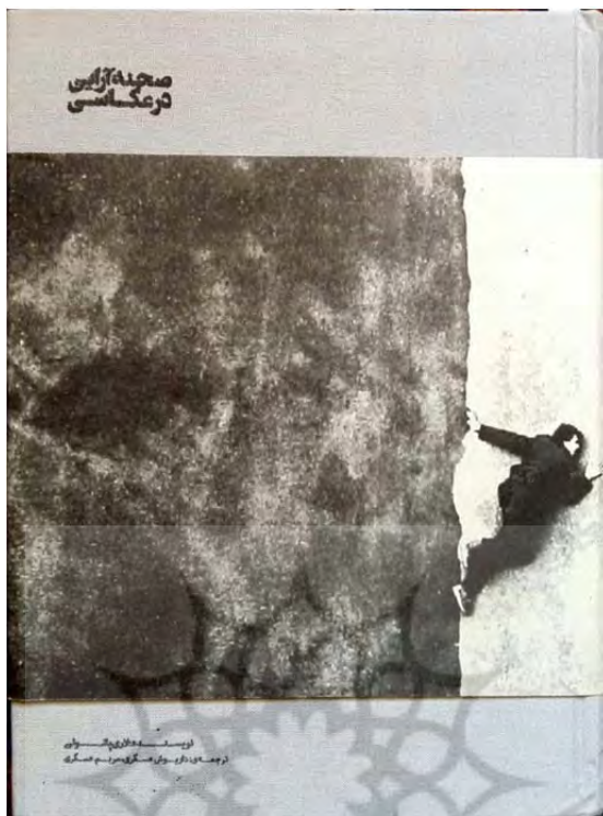
تصویر ۳. روی جلد کتاب ترجمه‌شده

عکس طرح جلد اصلی کتاب عکسی با عنوان «بدون عنوان» و تقریباً با این مضمون است (پسری دست در فاضلاب فروبرده است) که آن را گریگوری کروودسون (Gregory Crewdson) در سال ۲۰۰۱-۲۰۰۲ میلادی گرفته است (تصویر ۱)؛ درحالی‌که طرح روی جلد کتاب منتشرشده در ایران با نمونه اصلی بسیار متفاوت است. حتی طرح روی جلد تبلیغ‌شده در پایگاه عکاسی (akkasee.com) نیز با کتاب منتشرشده اندکی تفاوت می‌کند (تصویر ۲). تصویر روی جلد کتاب فارسی عکس - یا تصویری - از میرو اسولیک (Miro Svolik) عکاس چک با عنوان «وقتی به خانه بازگشتم» (سال ۱۹۸۶) است.