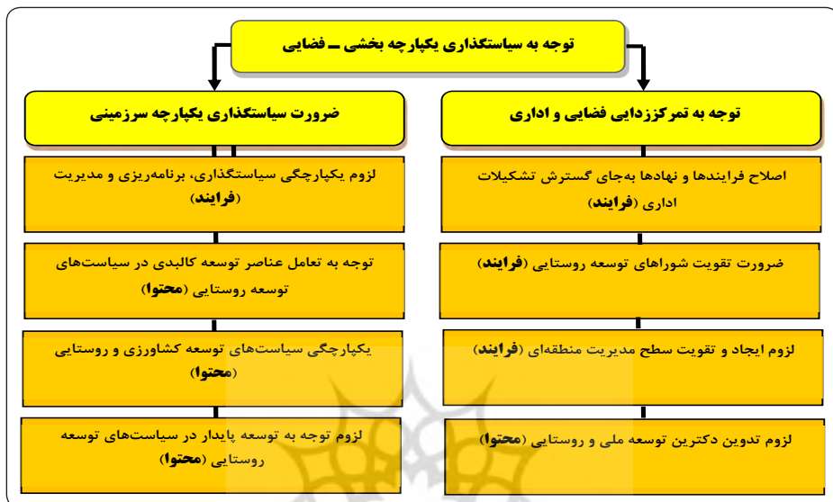
شکل ۲. الگوی راهبردهای تدوین سیاستگذاری فضایی