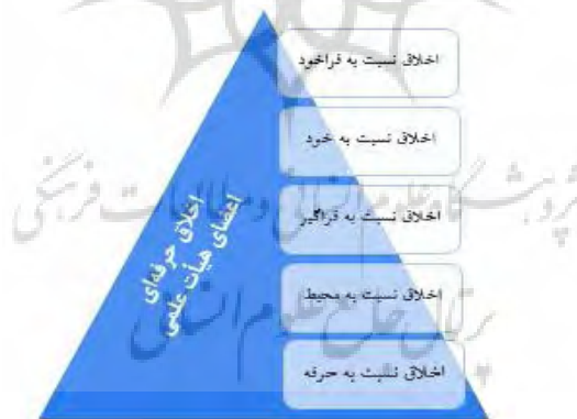
شکل 1: مدل مفهومی پژوهش

در پژوهش حاضر از مدل اخلاق حرفه‌ای مدرسان (قوشی و همکاران، 1396) استفاده شده است. البته محققان با اضافه کردن مؤلفه «نسبت به فراخود»، مدل مذکور را توسعه دادند. مدل مفهومی پژوهش در شکل 1 ترسیم شده است. در مدل اخلاق حرفه‌ای مدرسان، پنج بُعد اخلاق حرفه‌ای نسبت به فراخود، اخلاق حرفه‌ای نسبت به خود، اخلاق حرفه‌ای نسبت به فراگیر، اخلاق حرفه‌ای نسبت به محیط و اخلاق حرفه‌ای نسبت به حرفه آورده شده است.