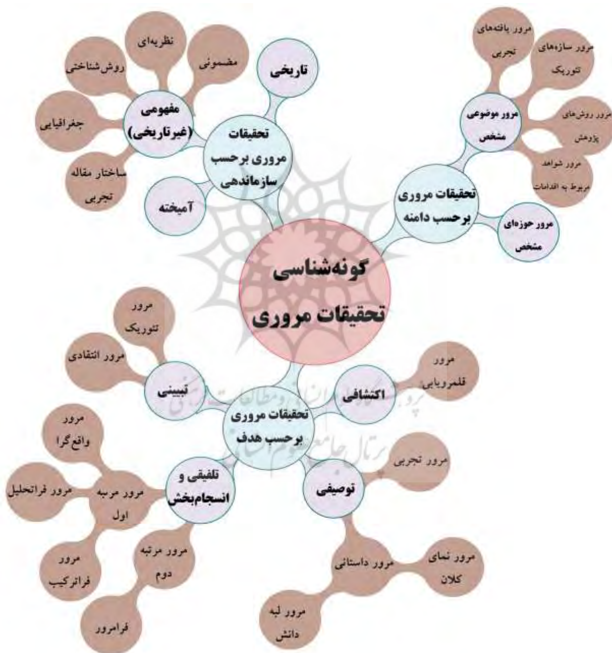
شکل ۲- نمایش مفهومی گونه‌شناسی تحقیقات مروری

جدول ۶ حکایت از ظرفیت‌های فراوان تحقیقات مروری در تولید دانش دارد که طیف گسترده‌ای را شامل می‌شود: تولید نقشه‌های دانشی، سیاستی و تصمیم‌گیری گوناگون، تصویرسازی از الگوها و روندهای پنهان در ادبیات، ارائه فهمی کلان و از بالا نسبت به موضوعات و دیدگاه‌های مرتبط، ارائه تبیین‌های جدید مبتنی بر تلفیق و ترکیب نتایج پراکنده در ادبیات، مشخص ساختن مسائل و