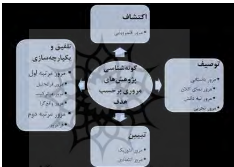
شکل ۱- انواع تحقیقات مروری برحسب هدف مرور