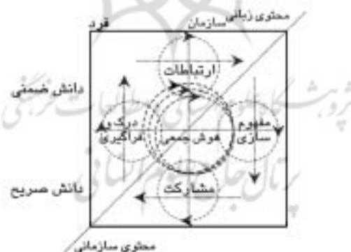
شکل ۲. خلق دانش سازمانی

در حیطه سازمانی، مصنوعات دانش، به عنوان مصنوعات دانش مفهوم‌سازی (C پنجم) می‌شوند. این مصنوعات از طریق تعامل میان تولیدکنندگان و مصرف‌کنندگان اطلاعات، در چارچوب گروهی از همکاران یا میان سایر سهامداران به عنوان ابزار مشارکت (C ششم) ایفای نقش می‌کند. به طور کلی، حمایت از ادراک و ارتباطات به یادگیری فردی کمک می‌نماید، و یادگیری سازمانی عمدتاً از طریق افراد و کوشش‌های ارتباطی و مشارکتی آنها صورت می‌پذیرد. همه این‌ها پیش‌گفته شده به رشد "همراهی" یا هوش جمعی (C هفتم) کمک می‌نمایند. این مورد ممکن است حافظه سازمانی هم نامیده شود.