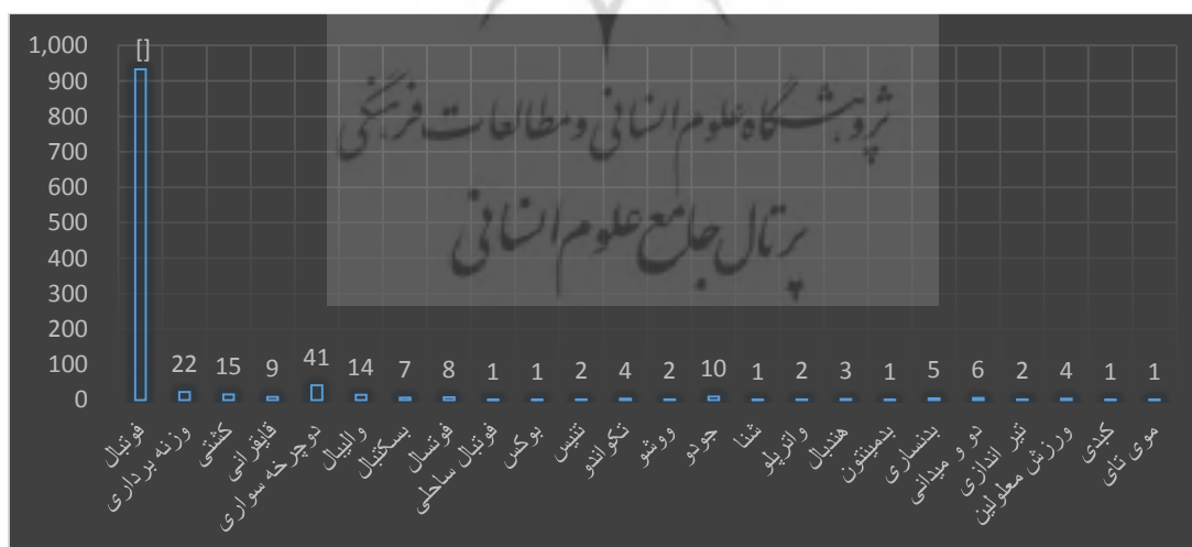
شکل ۱- رتبه‌بندی انواع ورزش‌ها بر حسب وقوع فساد در آن‌ها

۱۳۹۲ بیست و یک مورد، ۱۳۹۳ بیست و نه مورد، ۱۳۹۴ پنجاه و پنج مورد، ۱۳۹۵ پنجاه و یک مورد و در سال ۱۳۹۶ به شصت و سه مورد رسید. جزئیات کامل در شکل (۲) نمایش داده شده است.