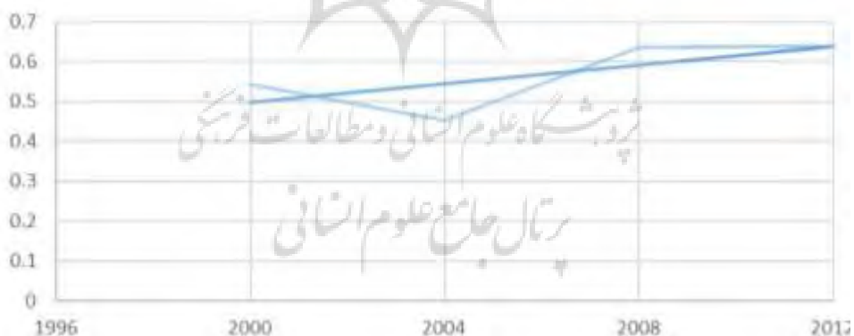
شکل ۲- میزان همبستگی تعداد پژوهشگران و تعداد مقالات