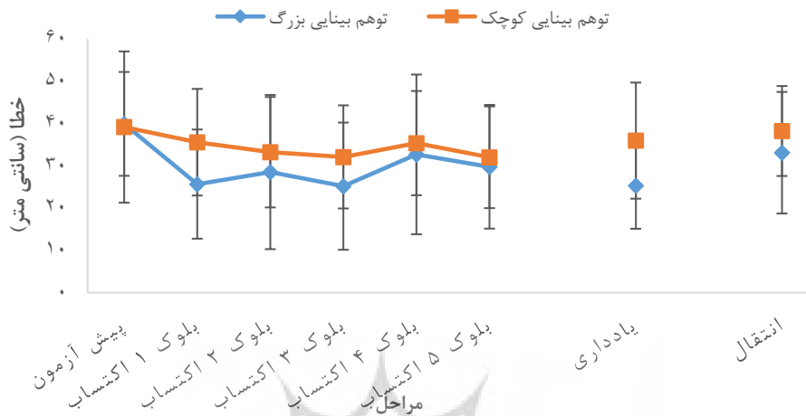
شکل ۱- خطای شعاعی گروه‌های توهم بینایی در مراحل مختلف پژوهش

دربارۀ نمرات خودکارمدی سالمندان، نتایج تحلیل واریانس مرکب با فرض کرویت موخلی ( P > 0.05 ) نشان داد که اثر اصلی مراحل معنادار بود ( F_{(2,40)} = 5.04, P = 0.01, \eta^2 = 0.20 ). نتایج آزمون بونفرونی برای مقایسه‌های جفتی مراحل نشان داد که بین نمرات خودکارآمدی هر دو گروه در مرحله پیش‌آزمون با مرحله پیش از یادداری تفاوت معنادار وجود دارد. سایر اثرهای اصلی گروه معنادار گزارش نشد (شکل شماره دو). و تعامل مراحل و گروه ( F_{(1,20)} = 0.41, P = 0.52, \eta^2 = 0.02 ),