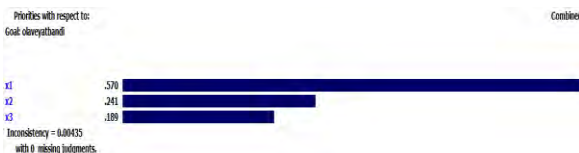
شکل ۳. وزن هر کدام از شاخص‌ها بر اساس مدل AHP

جهت وزن‌دار کردن، مقادیر ماتریس نرمال هر یک از گزینه‌ها بر وزن معیارها (که قبلاً از روش‌های دیگر به دست آمده بود) ضرب می‌گردد (جدول ۱۱ و ۱۲).