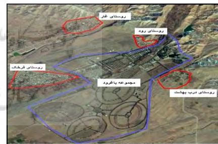
شکل ۳. موقعیت روستاهای مورد مطالعه نسبت به مجموعه باغرود