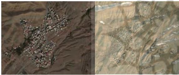
تصویر ۵. تصاویر هوایی از روستای محمودآباد در سال‌های ۲۰۱۷ و ۲۰۰۰

چشمگیرتر است. افزایش کاربری‌های ساخته‌شده در نواحی جنوبی، شمال و شمال شرقی و شمال غربی روستا بیشتر بوده به شکلی که توسعه‌ی روستا در قسمت غربی و شمال غربی به حد نهایی خود رسیده است و موانع طبیعی شامل ارتفاعات بلند مانع از توسعه روستا در این جهات می‌شود. نزدیک بودن روستا به کلان‌شهر کرج از مهم‌ترین علل توسعه ساخت‌وسازها در روستا بوده است. نکته بسیار مهم در مورد روستای محمودآباد توسعه‌ی عمودی و افزایش واحدهای آپارتمانی در روستا بوده است که این‌گونه توسعه، روستا را از توسعه معمول روستاهای دیگر (که غالباً به صورت افقی است) جدا می‌سازد. بهبود کیفی راه‌های ارتباطی نیز از دیگر تحولات کالبدی روستا در سال‌های اخیر بوده است.