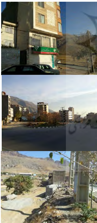
تصویر ۳. بهبود کمی و کیفی راه‌های ارتباطی و ارتباطات (پست و مخابرات و تلفن)، تخریب چشم‌انداز روستا