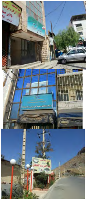
تصویر ۲. افزایش امکانات تفریحی و گردشگری، اداری و بهداشتی در روستاهای هدف