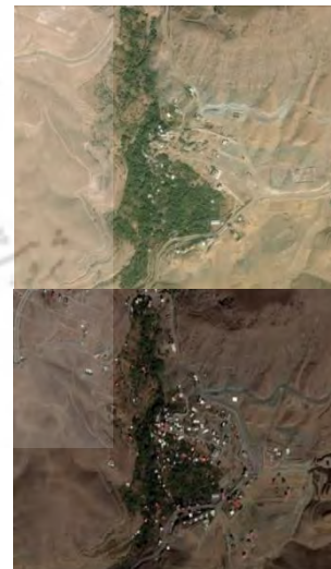
تصویر شماره ۴. تصاویر هوایی از روستای آتشگاه در سال‌های ۲۰۱۷ و ۲۰۰۰

می‌گردد قبل از هر تغییر افزایش واحدهای ساخته‌شده در طول ۱۵ سال کاملاً مشهود است. با توجه به برداشت‌های میدانی بیشتر واحدهای ساختمان شده کاربری مسکونی دارند. راه ارتباطی روستا در طول این سال‌ها به شکل کمربند روستا عمل کرده و ساخت‌وسازها در مرکز و تعداد محدودی نیز در شمال روستا ساخته‌شده‌اند و باوجود این‌که جهت توسعه روستا به سمت شرق مهیا بوده است اما راه ارتباطی به‌عنوان یک مانع انسانی عمل کرده و توسعه روستا به این سمت را محدود ساخته است. نکته‌ی حائز اهمیت دیگر در مورد روستای آتشگاه تخریب اراضی باغی و پوشش گیاهی درختان در طول سال‌های اخیر است. در روستای آتشگاه به علت افزایش کاربری‌های تفریحی - گردشگری شامل رستوران‌های بزرگ، تالارهای پذیرایی، کافه‌های سنتی و... سطح وسیعی از پوشش گیاهی این منطقه به زیر ساخت‌وسازها رفته و چشم‌انداز و محیط طبیعی روستا دچار تخریب شده است.