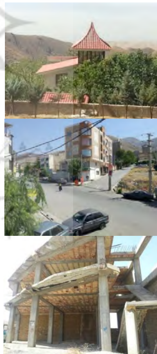
تصویر ۱. مقاوم‌سازی مسکن روستایی و استفاده از مصالح جدید و بادوام و افزایش تعداد واحدهای مسکونی با الگوی معماری شهری

در مورد روستای آتشگاه آنچه از مقایسه دو تصویر در فاصله سال‌های ۲۰۰۰ و ۲۰۱۷ (۱۷ سال) مشخص