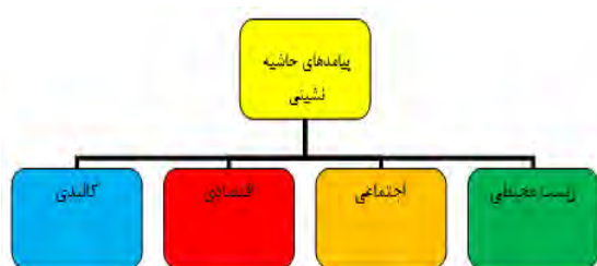
شکل ۴. پیامدهای حاشیه نشینی در شهر تبریز

بکارگیری هر یک از راهبردها، پیامدهایی دارد، به‌طورکلی پیامدهای که در راستای بروز پدیده حاشیه نشینی در محدوده مورد مطالعه ظهور می‌کنند، در ۴ گروه به شکل ۴ جمع‌بندی می‌شود: