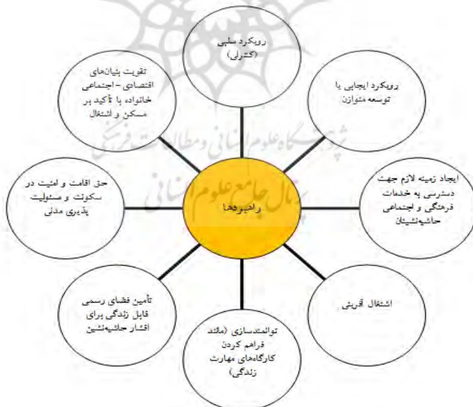
شکل ۳. راهبردهای حل مشکلات حاشیه‌نشین در محدوده مورد مطالعه

راهبردهای که برای حل مشکلات حاشیه‌نشین در محدوده مورد مطالعه شناسایی شده است عبارتند از: (۱) رویکرد سلبی (کنترلی)؛ (۲) رویکرد ایجابی یا توسعه متوازن؛ (۳) ایجاد زمینه لازم در جهت دسترسی به خدمات فرهنگی و اجتماعی حاشیه‌نشینان؛ (۴) اشتغال‌آفرینی؛ (۵) توانمندسازی (مانند فراهم کردن کارگاه‌های مهارت‌زندگی)؛ (۶) تأمین فضای رسمی قابل زندگی برای اقشار حاشیه‌نشین؛ (۷) حق اقامت و امنیت در سکونت به همراه مسئولیت‌پذیری مدنی؛ و (۸) تقویت بنیان‌های اقتصادی-اجتماعی خانواده با تأکید بر مسکن و اشتغال (شکل ۳).