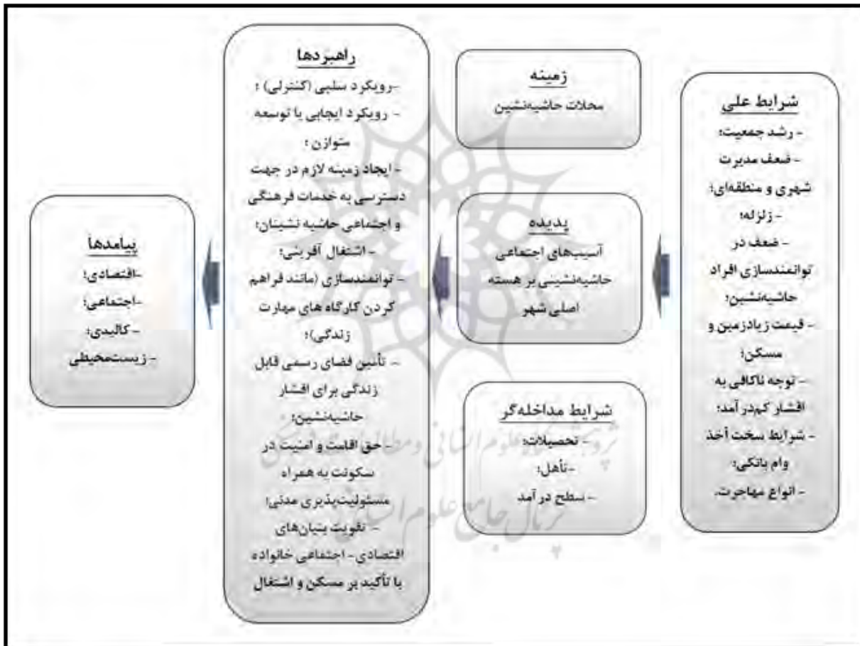
شکل ۲. مدل پارادایمی پدیده مسائل و مشکلات حاشیه‌نشینی، (مأخذ: یافته‌های تحقیق)