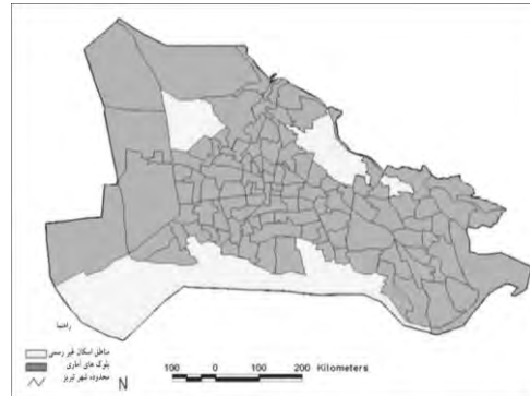
شکل ۱. نقشه محلات اسکان غیررسمی شهر تبریز

برای بررسی مسائل و مشکلات حاشیه‌نشینی، آسیب‌های اجتماعی و عوامل تأثیرگذار، شرایط مداخله‌گر و پیامدهای این تغییرات در محلات مورد بررسی در شهر تبریز و برای ایجاد درک عمیق‌تر نسبت به موضوع مورد بررسی، پی بردن به دیدگاه همه‌جانبه نسبت به موضوع و نیز برای برطرف نمودن ابهام بیان‌شده از روش نظریه بنیانی استفاده شده است (شکل ۲).