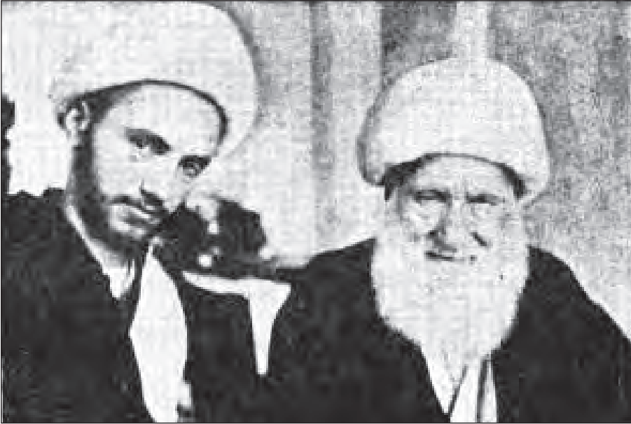
آیت‌الله علی‌اکبر نهایندی و فرزندش شیخ محمد نهایندی