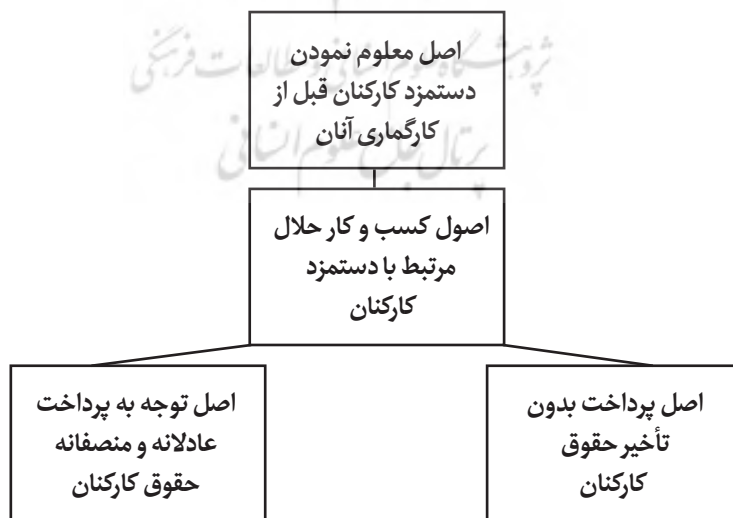
شکل ۱: اصول کسب و کار حلال مرتبط با دستمزد

این انتظار بجایی است که کارمند سازمان در قبال زحمتی که برای سازمان خود می‌کشد، از دستمزد منصفانه و عادلانه برخوردار شود. ضرورت توجه به این اصل اخلاقی در سازمان‌ها از آنجا ناشی می‌شود که گاه، سازمان‌ها به دلایل گوناگون، از جمله زیادبودن نیروی کار در مقایسه با تقاضای آن، مضطرب‌بودن فرد در یافتن شغلی که بتواند با آن روزی کسب کند و...، حقوقی کمتر از آنچه حق فرد است، به او پیشنهاد می‌دهند. کم‌دادن حق کارکنان در روایات، به شدت مذمت و نهی شده است. پیامبر خدا ه در این باره فرمودند: «کسی که مزد مزدوری را کم دهد، خداوند عملش را باطل گرداند و بوی بهشت را که از مسافت پانصدساله به مشام می‌رسد، بروی حرام کند» (شیخ صدوق، ۱۳۴۹، ص ۴۲۷). یکی دیگر از سفارش‌هایی که دربارهٔ دستمزد کارکنان شده است، پرداخت بی‌تأخیر آن است، تا جایی که در روایات آمده است، پیش از اینکه عرق کارگر، پس از اتمام کار خشک شود، مزد او را بپردازید (کلینی، ۱۳۵۹، ج ۵، ص ۲۸۹). همچنین، براساس قاعدهٔ رفتاری، انسان باید در انجام کارهایی که به او محول شده است، تمام توان خود را برای انجام آن به بهترین شکل به کار گیرد؛ در غیر این صورت، کوتاهی‌کردن در کار به پشیمانی و سرزنش و حسرت برای فرد منجر خواهد شد. باتوجه به این توضیحات، می‌توان اصول اسلامی در زمینهٔ حقوق و دستمزد را در شکل زیر نشان داد: