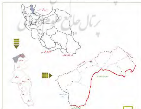
نقشه ۱: موقعیت جغرافیایی شهر اسلام آباد در استان اردبیل

شهر اسلام آباد در فاصله ۱۵ کیلومتری شهر پارس آباد و در شمال شرقی این شهر واقع شده است. براساس تقسیمات کشوری این شهر تا سال ۱۳۹۱ به عنوان نقطه روستایی به شمار می رفت که از این تاریخ به نقطه شهری ارتقا پیدا کرده است. این شهر از جانب شمال به رودخانه ارس به عنوان خط مرزی جمهوری اسلامی ایران با کشور آذربایجان، از شرق و جنوب شرقی به روستای اسلام آباد جدید و از غرب به روستای توپراق کندی منتهی می شود. اسلام آباد در عرض شرقی ۴۷ درجه و ۴۲ دقیقه و در طول شمالی ۳۹ درجه و ۳۵ دقیقه واقع بوده و متوسط ارتفاع آن از سطح دریاهای آزاد معادل ۸۰ متر برآورد شده است.