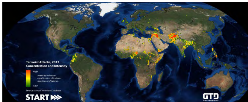
شکل ۱. حملات تروریستی جهان در سال ۲۰۱۳ (Global Terrorism Database)