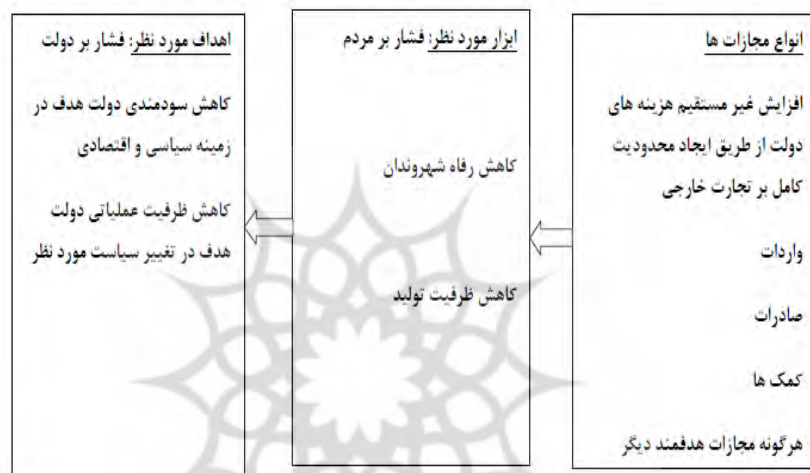
شکل ۳. اهداف راهبردی آمریکا و اتحادیه اروپا از تحریم اقتصادی ایران

تحریم اقتصادی ایران را می‌توان در قالب سیاستگذاری چندجانبه نامتوازن جهان غرب تحلیل کرد. هدف اصلی ایالات متحده آمریکا افزایش غیرمستقیم هزینه‌های دولت از راه ایجاد محدودیت کامل بر تجارت خارجی بوده است. این محدودیت‌ها در حوزه‌های تجارت خارجی، مالی، فناوریانه و دیپلماتیک اعمال شده است. همان‌گونه که در شکل ۳ مشاهده می‌شود، هدف آمریکا و اتحادیه اروپا از اعمال سیاستگذاری چندجانبه نامتوازن، کاهش قابلیت‌های عمومی دولت و جامعه است. نشانه‌های این فرایند در شکل ۳ مشاهده می‌شود.