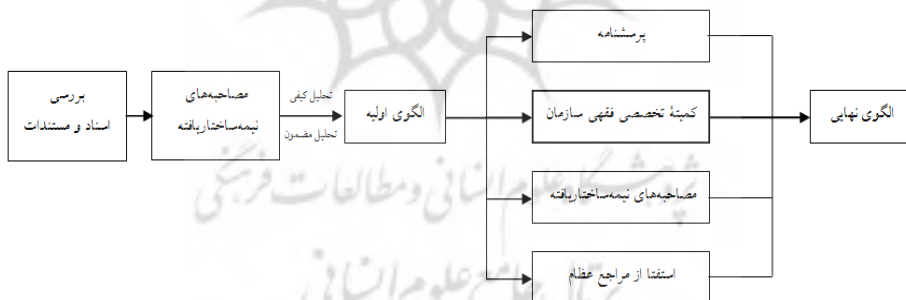
شکل (۳): فرآیند روش تحقیق

روش تحقیق حاضر همان‌گونه که در شکل ذیل مشاهده می‌شود، دلفی کیفی است که با بررسی اسناد آغاز شده و با نظرسنجی از خبرگان از طریق مصاحبه، پرسشنامه و جلسات گروهی ادامه می‌یابد.