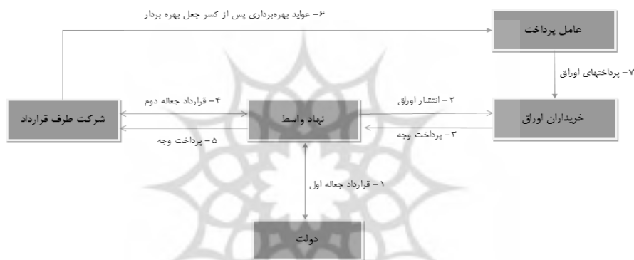
شکل (۲): مدل انتشار اوراق جعاله جهت تأمین مالی پروژه در قبال حق بهره‌برداری برای زمان معین و انتقال (BOT) ۱۲