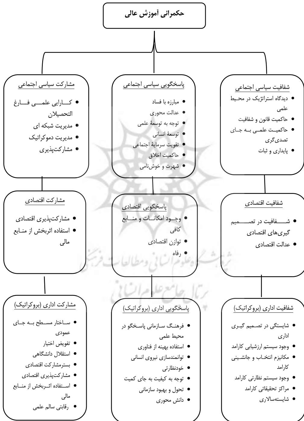
شکل ۲. مدل پیشنهادی پژوهش جهت حکمرانی آموزش عالی

شاهد انگیزش بیشتر آن‌ها و ارتقای عملکردی فردی آن‌ها خواهیم بود» «بهره‌مندی از نظرات دیگر افراد و مشارکت دادن آن‌ها در تصمیمات منجر به ارتقای سطوح تعهد و بهبود عملکرد فردی آن‌ها می‌شود».