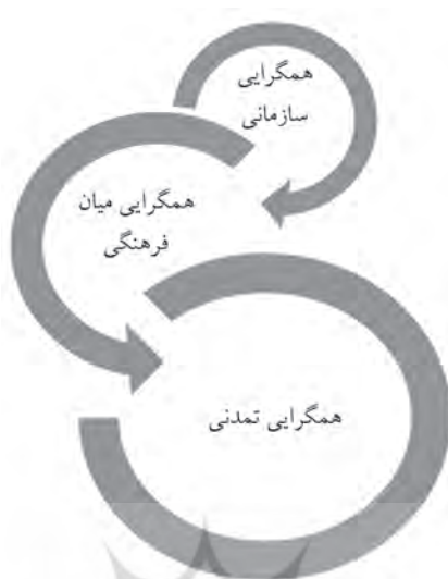
شکل ۱. سطوح مختلف همگرایی