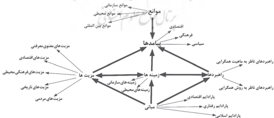
شکل ۳. ارتباط بین مضامین سازمان‌دهنده «همگرایی عتبات مقدسه»

بر اساس یافته‌های این پژوهش، با توجه به تحلیل مضمون اطلاعات جمع‌آوری شده می‌توان ۵۸ مضمون اولیه، ۱۸ مضمون پایه و ۶ مضمون اصلی و سازمان‌دهنده برای مضمون محوری و فراگیر «همگرایی عتبات مقدسه» شناسایی کرد. ۱۸ مضمون پایه و فرعی عبارتند از: «موانع سازمانی»، «موانع محیطی»، «موانع بین‌المللی»، «زمینه‌های سازمانی»، «زمینه‌های محیطی»، «راهبردهای ناظر به ماهیت همگرایی»، «راهبردهای ناظر به روش همگرایی»، «پارادایم اقتصادی»، «پارادایم رفتاری»، «پارادایم اسلامی»، «مزیت‌های معنوی-معرفتی»، «مزیت‌های اقتصادی»، «مزیت‌های فرهنگی-محیطی»، «مزیت‌های تاریخی» و «مزیت‌های مردمی». مضمون‌های اصلی و سازمان‌دهنده عبارتند از: «مزیت‌ها»، «مبانی»، «زمینه‌ها»، «موانع»، «پیامدها» و «راهبردها». با استفاده از نرم‌افزار Maxqda ارتباط بین مضامین سازمان‌دهنده را می‌توان در شکل ۳ نشان داد.