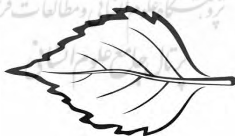
شکل شماره ۱. طرحی از الگوی رگ‌برگی

این شیوه روایت‌گری خداوند بسیار شبیه به رگ‌برگ‌های برگ یک گیاه است. در هر برگ، یک رگ‌برگ اصلی وجود دارد که برگ را به دو فضای مستقل از هم جدا می‌کند. با کمی فاصله گرفتن از ابتدای برگ، یک رگ‌برگ فرعی از رگ‌برگ اصلی به سمت راست جدا می‌شود و کمی جلوتر، یک رگ‌برگ فرعی به سمت چپ جدا می‌شود و بعد از آن دوباره یک رگ‌برگ به سمت راست و رگ‌برگ دیگر به سمت چپ جدا می‌شود و این روند تا انتهای برگ ادامه می‌یابد. در الگوی رگ‌برگی نیز روایت از دو فضای مستقل از هم تشکیل شده است و سیر روایت در هر فضا به صورت مستقل پی‌گرفته می‌شود. در این شیوه روایت‌گری، راوی بعد از پیش بردن بخشی از روایت در فضای اول، سراغ فضای دوم آمده و بخشی از رخداد‌های آن فضا را تبیین می‌کند. بعد از آن دوباره به روایت، در فضای اول باز می‌گردد و با این نظم روایت را تا انتها پیش می‌برد. شکل شماره (۱) طرحی از این الگو را نشان می‌دهد.