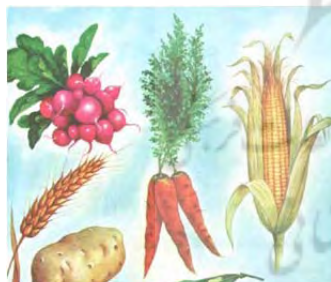
تصویر ۴: تصویرسازی درس چهارم