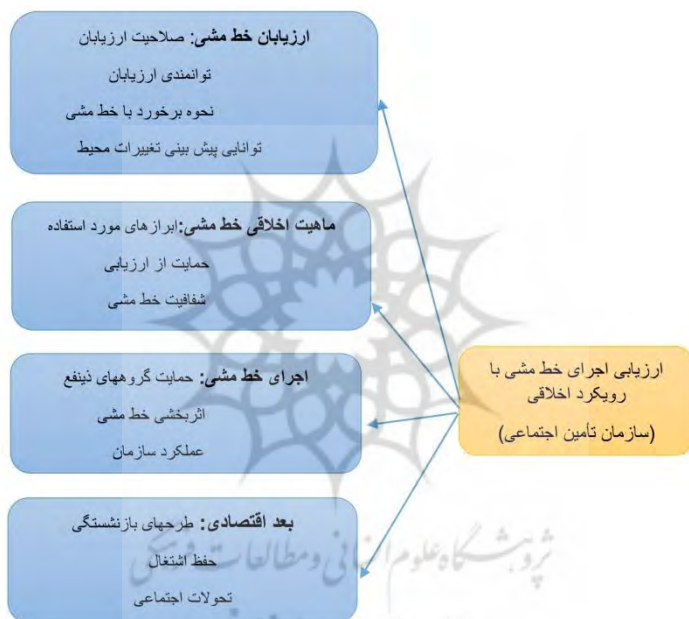
شکل ۲- مدل مفهومی ارزیابی خط مشی عمومی (پس از اجرا)

به منظور پاسخ به سوال فرعی اول "ابعاد، مؤلفه‌ها و شاخص‌های ارزیابی خط‌مشی‌های سازمان تأمین اجتماعی (پس از اجرا) با رویکرد اقتصادی کدام است؟" از تحلیل دلفی استفاده می‌گردد. جهت شناسایی ابعاد و مؤلفه‌ها، در ابتدا محقق با مطالعه ادبیات نظری تحقیق و سایر پژوهش‌های این حوزه اقدام به شناسایی عوامل موثر کرده است و در مرحله دوم عوامل شناسایی شده در غالب پرسشنامه ای در اختیار خبرگان (جهت تایید عامل‌های شناسایی شده) قرار داده شد. نهایت اینکه الگوی مفهومی ارزیابی خط مشی عمومی (پس از اجرا) با ۴ محور اصلی، ۱۲ بعد و ۷۱ مؤلفه مورد تایید قرار گرفت و به شکل زیر ترسیم شد.