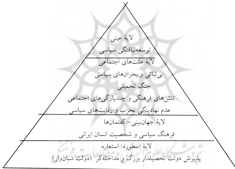
نمودار ۲. بازدارنده‌های توسعه سیاسی در ایران، براساس مدل تحلیل لایه‌ای علت‌ها

با بهره‌گیری از روش تحلیل لایه‌ای علت‌ها، و براساس روش‌های پس‌نگری روند تحولات سیاسی، مدل مفهومی توسعه‌نیافتگی سیاسی جامعه ایرانی در این پژوهش، به صورت نمودار ۲ به نمایش درآمده است: