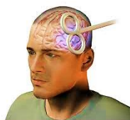
شکل ۱: حالت عمومی نحوه قرارگیری الکتروود و مبانی اعمال تحریک مغناطیسی مغز

میدان الکتریکی تأثیری بر روی پوست و استخوان ندارد اما نورون‌های مغز با این تغییر کوتاه مدت در میدان مغناطیسی تحت تأثیر قرار می‌گیرند. این امر بطور موثری موجب القای یک جریان الکتریکی در آکسون‌های نورون‌های موجود در قشر مغز می‌شود. این نورون‌ها پیام را در جسم سلولی خود و نورون‌های مجاور انتقال می‌دهند (بوئینگ و سایرین، ۱۹۹۷؛ لوپز-ایبرو، لوپز-ایبرو و پا سترانا، ۲۰۰۸؛ میلز، ۲۰۱۷).