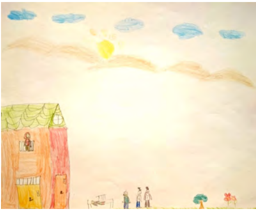
شکل ۴- ترسیم خانواده‌ی بیمار در جریان انتقال کودک به بیمارستان

نگاه کودک به روند بیماری: براساس داده‌های جمع‌آوری شده در مصاحبه و نقاشی مشخص شد که کودکان بیمار نسبت به روند بیماری خود نیز دیدگاه ویژه‌ای پیدا می‌کنند. در این مقوله، مفاهیم «ارزیابی منفی از درمان»، «ارزیابی مثبت از درمان»، «ارزیابی منفی نسبت به بیماری»، «آگاهی به فرایند طی‌شده در جریان درمان»، «بیان مستقیم تجارب»، «تمایل به بازگشت به خانه» و «آگاهی به شرایط ویژه‌ی بیماری» قرار دارند. به عنوان نمونه: کودک ۸ ساله: وقتی که بخیه‌شو کشید میتونه بره بازی کنه. ولی بدوبدونه!