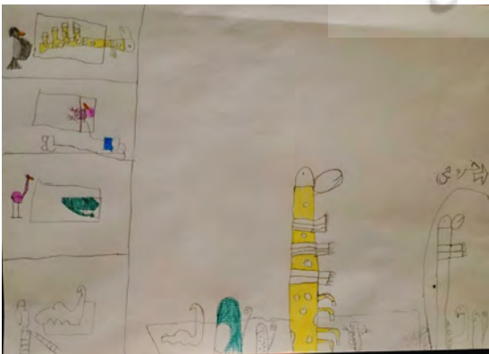
شکل ۵- حضور حیوانات بیمار در بخش‌های مختلف مرکز درمانی

در نهایت، این مقوله‌ها، در مقوله‌ی کلی‌تری قرار می‌گیرند که همان دیدگاه کودک از بیماریاش و پیامدهای ناشی از آن است.