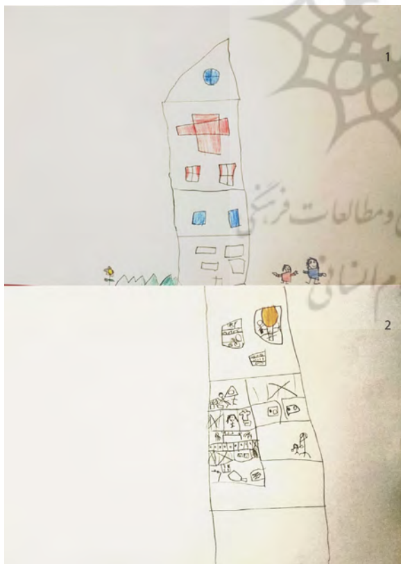
شکل ۱- ترسیم کارکنان و محل درمان توسط کودک

کودک ۸ساله: به خاطر اینکه مریضه دلش براش می‌سوزه. (ارزیابی مثبت از کارکنان درمانی)