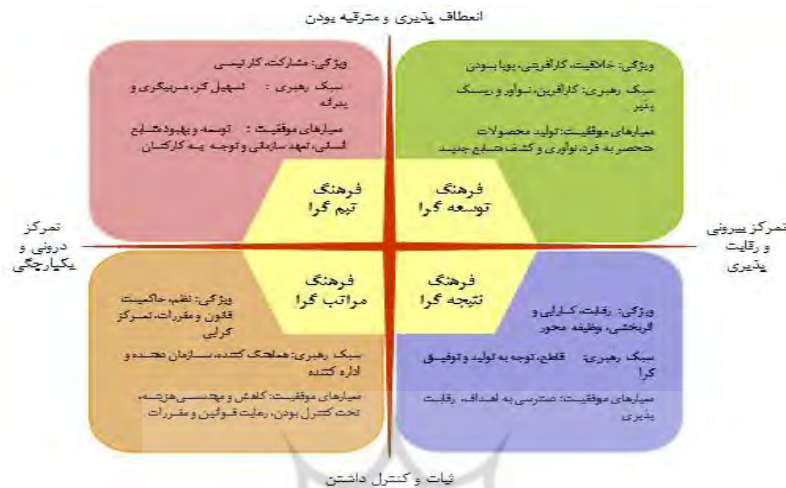
شکل ۲- مدل فرهنگ سازمانی کوئین و کامرون (۲۰۰۶)

آنها پیشنهاد کردند که چارچوب ارزش‌های رقابتی می‌توانند به منظور بررسی ساختار عمیق فرهنگ سازمانی، باورهای اساسی، انگیزه‌ها، رهبری، تصمیم‌گیری، اثربخشی، ارزش‌ها و سایر موارد سازمان به کار رود (Koocheki Siyah Khaleh Sar et al, 2011). مدل فرهنگ سازمانی کوئین و کامرون در شکل ۲ مشاهده می‌گردد.