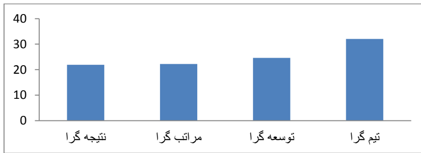
نمودار ۲- نمودار ستونی میانگین انواع فرهنگ سازمانی از نظر معلمان در وضعیت مطلوب

سوال ۲: آیا بین دیدگاه معلمان در مورد فرهنگ کلی با توجه به پست‌های سازمانی دبیر، مدیر و کارشناس اداره تفاوتی وجود دارد؟ برای بررسی تفاوت معناداری دیدگاه معلمان در پست‌های سازمانی دبیری، مدیریتی و کارشناسی از تحلیل واریانس یک طرفه استفاده شد و نتایج زیر به دست آمد.