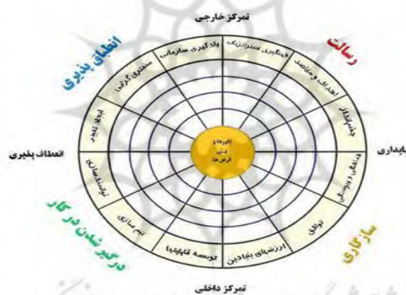
شکل ۱- مدل فرهنگ سازمانی دنیسون

دنیسون مدتی بیش از ۲۰ سال در جهت یافتن شیوه‌ای برای اندازه‌گیری رفتارها و اعتقادات مرتبط با عملکرد کاری، کار و پژوهش انجام داده است و مدل پیمایشی وی به جای آن که بر روی جو عاطفی و کلی محل کار تمرکز پیدا کند، به مفروضات، ارزش و اعتقاداتی تکیه دارد که به‌طور مستقیم بر عملکرد سازمانی تاثیر می‌گذارد. در هر مرحله برای روا نمودن مقیاس و مدل خود، آنها را در جهان واقعی مورد آزمایش قرار داده است. موارد پرسشنامه وی آن‌گونه خاص و ریز شده است که یک نمره کم در یک مورد بیان‌کننده انجام یک عمل نادرست در سازمان است (Monavarian et al. 2008). همان‌طور که در شکل زیر مشاهده می‌شود، این مدل دارای چهار ویژگی اصلی فرهنگ سازمانی یعنی درگیر کردن، سازگاری، یکپارچگی و مأموریت است.