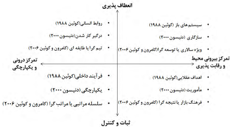
شکل ۳- تطبیق مدل دنیسون با کوئین و کامرون در چارچوب ارزش‌های رقابتی

به این ترتیب مطالعات تطبیقی مدل‌های مبتنی بر ارزش‌های رقابتی می‌تواند پژوهش‌های فرهنگی را به خلق مدل‌های جدید سوق داده و با یکپارچه‌سازی آنها می‌توان به میزان بیشتری به سمت مفروضات جهان شمول دست یافت.