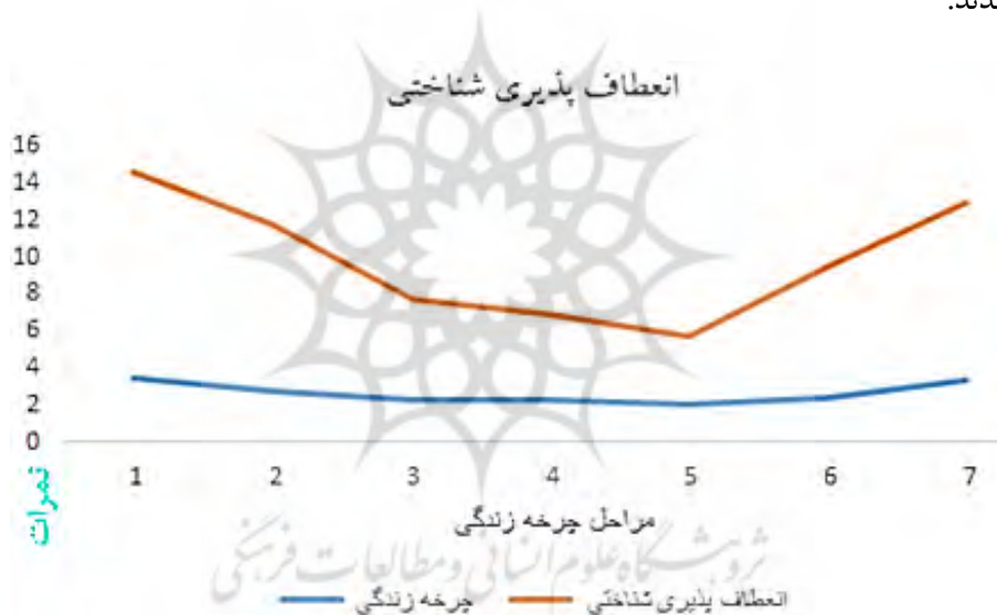
نمودار ۱: تحلیل روند مراحل چرخه زندگی و انعطاف‌پذیری شناختی

به منظور بررسی رابطه بین متغیر انعطاف‌پذیری شناختی و مراحل مختلف چرخه زندگی از روش تحلیل رگرسیون منحنی استفاده شد. در این روش مراحل چرخه زندگی خانواده به عنوان متغیر پیش‌بین و متغیر انعطاف‌پذیری شناختی به عنوان متغیر ملاک وارد تحلیل شدند.