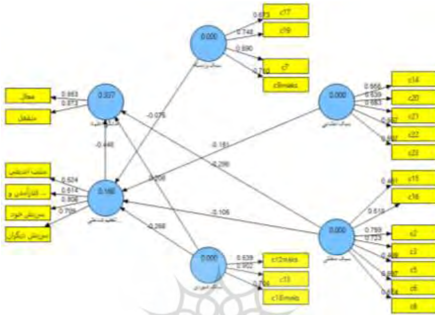
شکل ۳: بار عاملی و ضریب تعیین متغیرها و سؤالات

در تحلیل معادلات ساختاری اثر مستقیم بین چهار سبک تصمیم‌گیری با آمادگی اعتیاد در قالب بخش مدل ساختاری سنجیده شده که در جدول ۳ ارائه شده است. ارتباط متغیر سبک منطقی با متغیر آمادگی اعتیاد ( T=۸/۶۱ , B=-۰/۲۹ ) منفی و معنادار است ( p<۰/۰۰۱ ). ارتباط متغیر سبک شهودی با متغیر آمادگی اعتیاد ( T=۵/۲۸ , B=۰/۲۱ ) مثبت و معنادار است ( p<۰/۰۰۱ ).