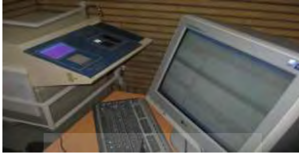
شکل ۳: اولین نمونه از خودپرداز شربت متادون مستقر در مرکز ملی مطالعات اعتیاد

سیستم اتوماتیک توزیع دارو (که در بیرون مرکز درمان اعتیاد می تواند قرار گیرد) در واقع به عنوان واسط ارتباطی بین پزشک و بیمار عمل می کند و وظیفه دارد که بر اساس نسخه تجویز شده توسط پزشک، داروی مورد نیاز هر بیمار را در اختیار او قرار دهد (شکل ۳).