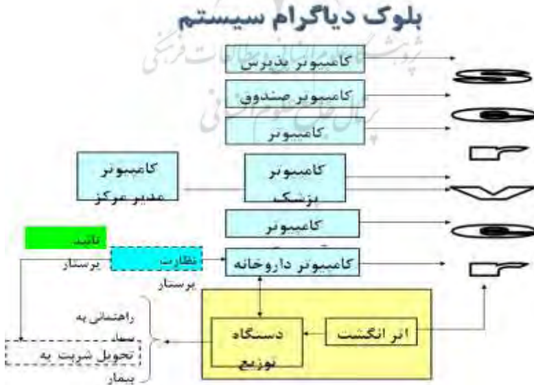
شکل ۲: بلوک دیگرام شبکه مکانیزاسیون داخلی مرکز درمانی اعتبار

ساختار شبکه داخلی مکانیزاسیون مرکز درمانی در شکل ۲ ارائه شده است.