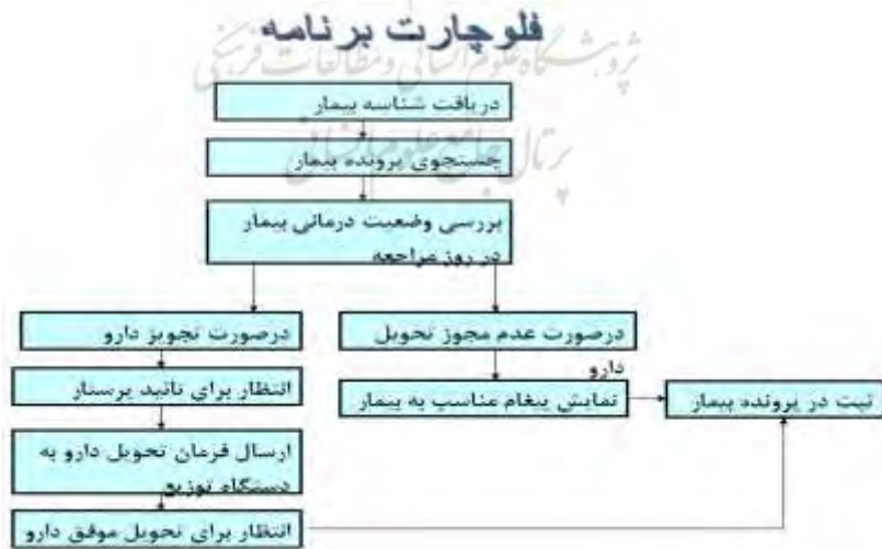
شکل ۴: فلوچارت تصمیم‌گیری ارائه شربت متادون به بیمار

شامل دو شیر برقی، پمپ روتاری و دریچه‌های ورودی. در هنگام لزوم به پر شدن محفظه‌ها، تنها با استفاده از رمز عبور اپراتور مجاز، این عملیات انجام خواهد شد. نحوه عملکرد سیستم به این ترتیب می‌باشد که بیمار با استفاده از اثر انگشت و کارت RFID خود را به دستگاه معرفی می‌کند. این اطلاعات توسط رایانه متصل به سرور محلی مرکز، مورد تحلیل قرار می‌گیرد. اگر پس از مراحل مندرج در فلوچارت شکل ۴، ارائه دارو به بیمار مورد تأیید سیستم و پرستار قرار گرفت، آنگاه شیر برقی مربوط به محفظه متادون باز شده و همزمان یک پمپ مالشی به کار می‌افتد. این پمپ متادون را به داخل محفظه میکسر هدایت می‌نماید. مقدار شربت ورودی به محفظه میکسر توسط سنسور وزن مشخص می‌شود، عملکرد پمپ و شیر برقی تا زمانی که مقدار داروی مورد نظر وارد محفظه میکسر نشده باشد، ادامه می‌یابد. به محض رسیدن مقدار مایع درون میکسر به مقدار مورد نظر، عملکرد پمپ و شیر برقی قطع می‌شود. برای جلوگیری از امکان فروش دارو توسط فرد معتاد، آب نیز به مقدار دو برابر مقدار دارو، وارد میکسر می‌شود. در نهایت پمپ روتاری خروجی، فعال شده و مخلوط حاصل از مراحل قبل را در لیوان مراجعه کننده می‌ریزد (البته قبلاً باید لیوان در جای مخصوص به خود قرار بگیرد و این موضوع توسط یک زوج نوری مادون قرمز مشخص می‌شود).