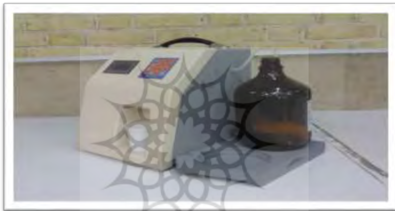
شکل ۵: نمونه بهینه سازی شده دستگاه توزیع شربت متادون

ن: پس از ساخت نمونه اولیه دستگاه خودپرداز شربت متادون، بررسی‌های انجام شده نشان داد در حال حاضر استفاده از یک خودپرداز کاملاً خودکار برای ارائه شربت متادون به بیماران از نظر اصول نظارتی بهداشتی کشور امکان‌پذیر نیست. بنابراین تصمیم گرفته شد یک دستگاه رومیزی توزیع شربت متادون ساخته شود. در این طرح دیگر محفظه نگهداری شربت متادون داخل دستگاه قرار نمی‌گیرند و دستگاه تنها مسئولیت ارائه دوز مورد نظر شربت را در قالب یک سیستم مرکزی خواهد داشت. بقیه اصول کارکردی این سیستم شبیه به مورد قبلی است. شکل ۵ دستگاه نهائی بهینه شده را نشان می‌دهد.